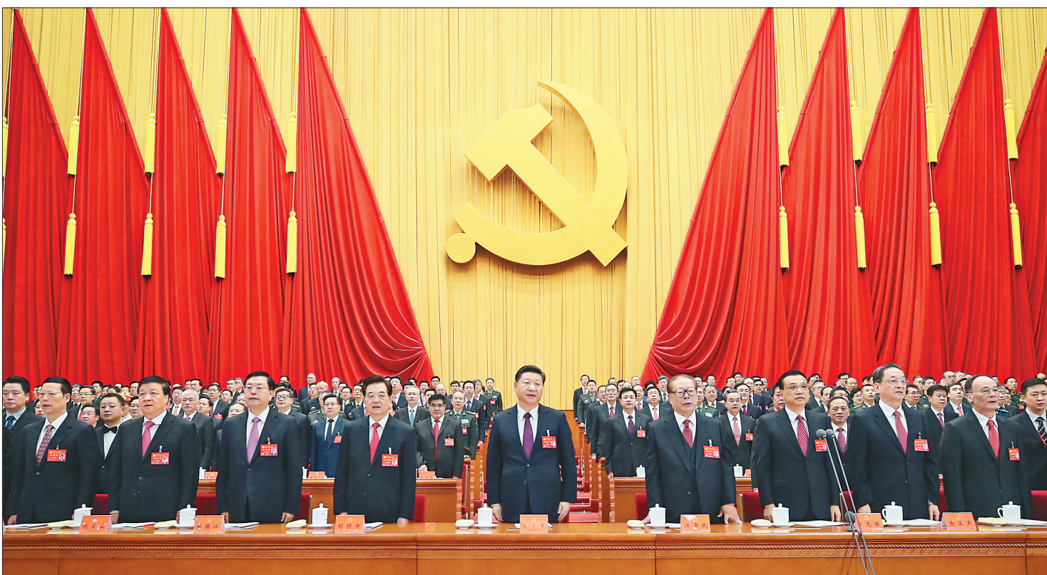
10月18日,中国共产党第十九次全国代表大会在北京人民大会堂开幕。这是习近平、李克强、张德江、俞正声、刘云山、王岐山、张高丽、江泽民、胡锦涛在主席台上。

新华社北京10月18日电 绘就伟大梦想新蓝图,开启伟大事业新时代。举世瞩目的中国共产党第十九次全国代表大会18日上午在人民大会堂开幕。 习近平代表第十八届中央委员会向大会作了题为《决胜全面建成小康社会 夺取新时代中国特色社会主义伟大胜利》的报告。习近平指出,中国共产党第十九次全国代表大会,是在全面建成小康社会决胜阶段、中国特色社会主义进入新时代的关键时期召开的一次十分重要的大会。大会的主题是:不忘初心,牢记使命,高举中国特色社会主义伟大旗帜,决胜全面建成小康社会,夺取新时代中国特色社会主义伟大胜利,为实现中华民族伟大复兴的中国梦不懈奋斗。 人民大会堂雄伟庄严,万人礼堂气氛热烈。主席台上方悬挂着“中国共产党第十九次全国代表大会”的会标,后幕正中是镰刀和锤头组成的党徽,10面鲜艳的红旗分列两侧。二楼和三楼阳台上分别悬挂着“不忘初心,牢记使命,高举中国特色社会主义伟大旗帜,决胜全面建成小康社会,夺取新时代中国特色社会主义伟大胜利,为实现中华民族伟大复兴的中国梦不懈奋斗!”“伟大、光荣、正确的中国共产党万岁!”的横幅。 在主席台前排就座的大会主席团常务委员有习近平、李克强、张德江、俞正声、刘云山、王岐山、张高丽、马凯、王沪宁、刘延东、刘奇葆、许其亮、孙春兰、李建国、李源潮、汪洋、张春贤、范长龙、孟建柱、赵乐际、胡春华、栗战书、郭金龙、韩正、江泽民、胡锦涛、李鹏、朱镕基、李瑞环、吴邦国、温家宝、贾庆林、宋平、李岚清、曾庆红、吴官正、李长春、贺国强、杜青林、赵洪祝、杨晶。 大会由李克强主持。上午9时,会议开始。全场起立,高唱《中华人民共和国国歌》。随后,全体同志为毛泽东、周恩来、刘少奇、朱德、邓小平、陈云等已故老一辈无产阶级革命家和革命先烈默哀。 李克强宣布,党的十九大应出席代表2280人,特邀代表74人,共2354人,