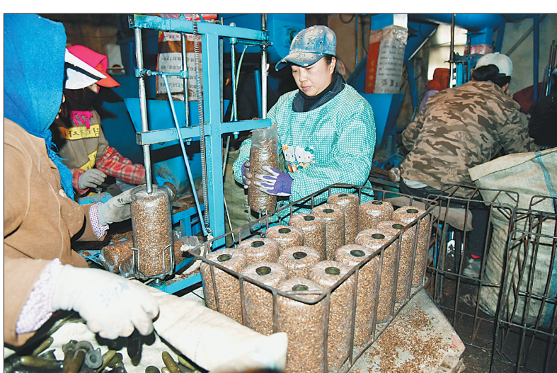
勃利县大四站镇小连村柏成木耳专业合作社。

遇的成功典范。七台河市抢抓国家推进光伏扶贫良机,在勃利县杏树乡永久村进行了光伏扶贫试点,2016年末全县建成了3千瓦的分布式光伏电站555个。2017年,为了适应新的光伏扶贫政策,市政府多次召开光伏扶贫项目推进会,及时调整了思路,修改了备案,逐步完善各类前置条件。计划建设29座集中式村级电站和930个分布式5千瓦户用电站。目前,已有12个村正在平整土地,近期将安装光伏设备。项目建成后惠及贫困户3630户,每户年收入标准为3000元。