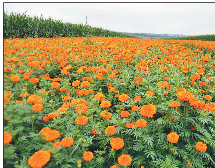
黑龙江中利生物科技有限公司今年在勃利县和农民签约种植万寿菊面积增至24000亩。 本报记者 文天心摄

住建部门对贫困户住房进行摸底排查,积极对上争取危房改造项目和资金。各区县创新住房安全方式,保障住房安全。勃利县建档立卡贫困户危房改造补助标准为3.4万元(住建局补助1.4万元,县补贴资金2万元)。目前勃利县共有2135户危房家庭,其中有建房意愿的1415户,没有建房意愿的危房家庭,通过租房或者置换方式解决,租房补助每户提高到90元。目前全县已开工建设1150户,建完350户。