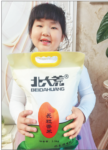
收到奖品大米的小朋友很高兴。