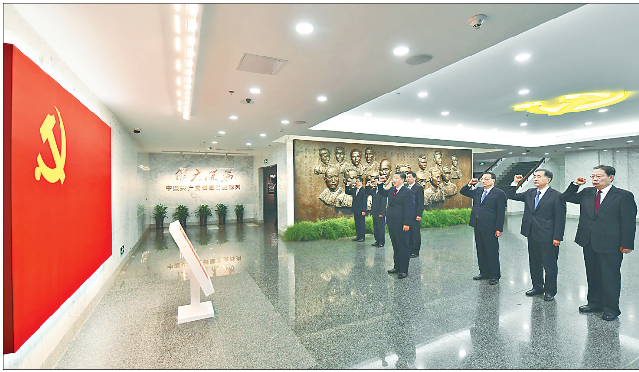
10月31日上午，在上海中共一大会址纪念馆，习近平带领其他中共中央政治局常委同志一起重温入党誓词。