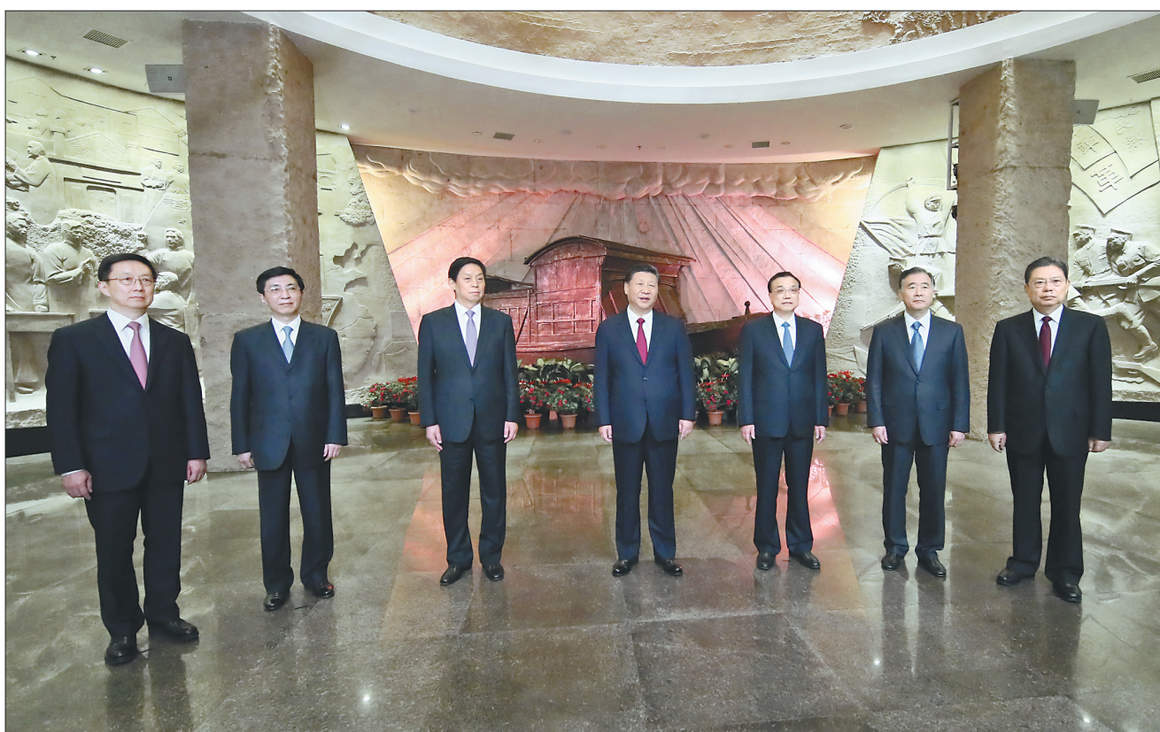
10月31日下午，习近平在南湖革命纪念馆参观结束时发表重要讲话。

纪念馆圆形序厅里，精美的红船雕塑栩栩如生，硕大的镰刀锤头图案鲜艳夺目，二者交相辉映，寓意中国共产党领航中国号巨轮破浪前行。习近平等由此进入以“开天辟地”为主题的展厅，先后参观了“探索救亡图存道路”、“中国共产党成立”等专题展览。这里展出的实物和图片，同上海中共一大会址的展览互为印证，详实记录了中国共产党诞生的历史全貌。（下转第三版）