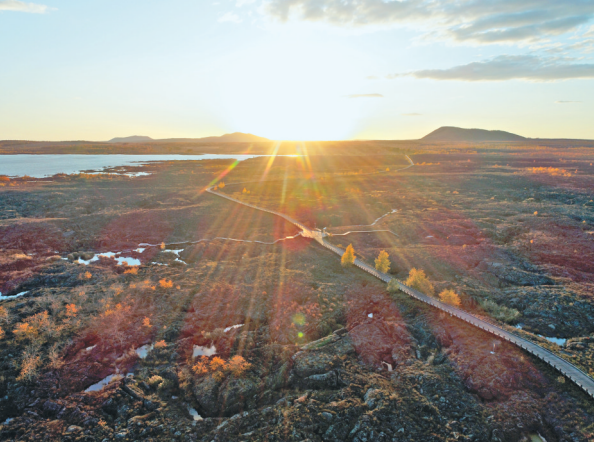
五大连池,秋风送爽。