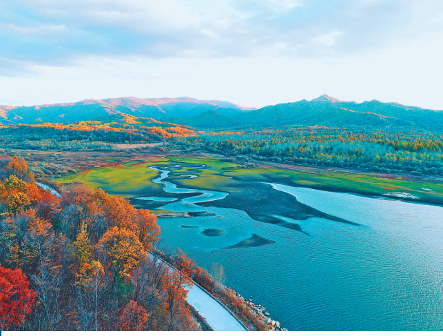
山色妖娆,生态龙江。