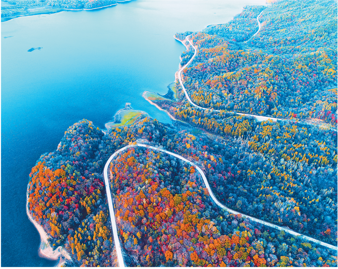
↑ 走进秋色里,人在画中游。