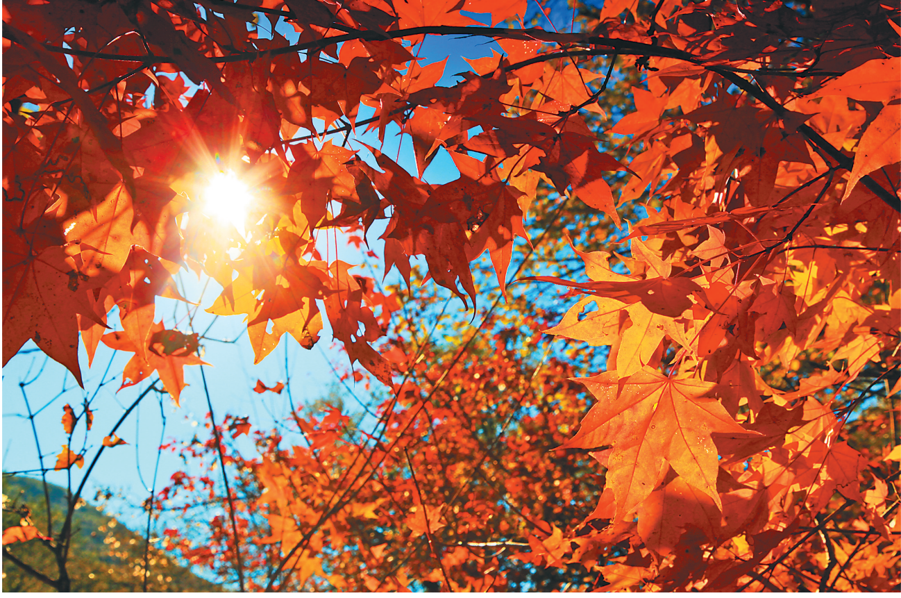
霜叶映红日,美在不言中。