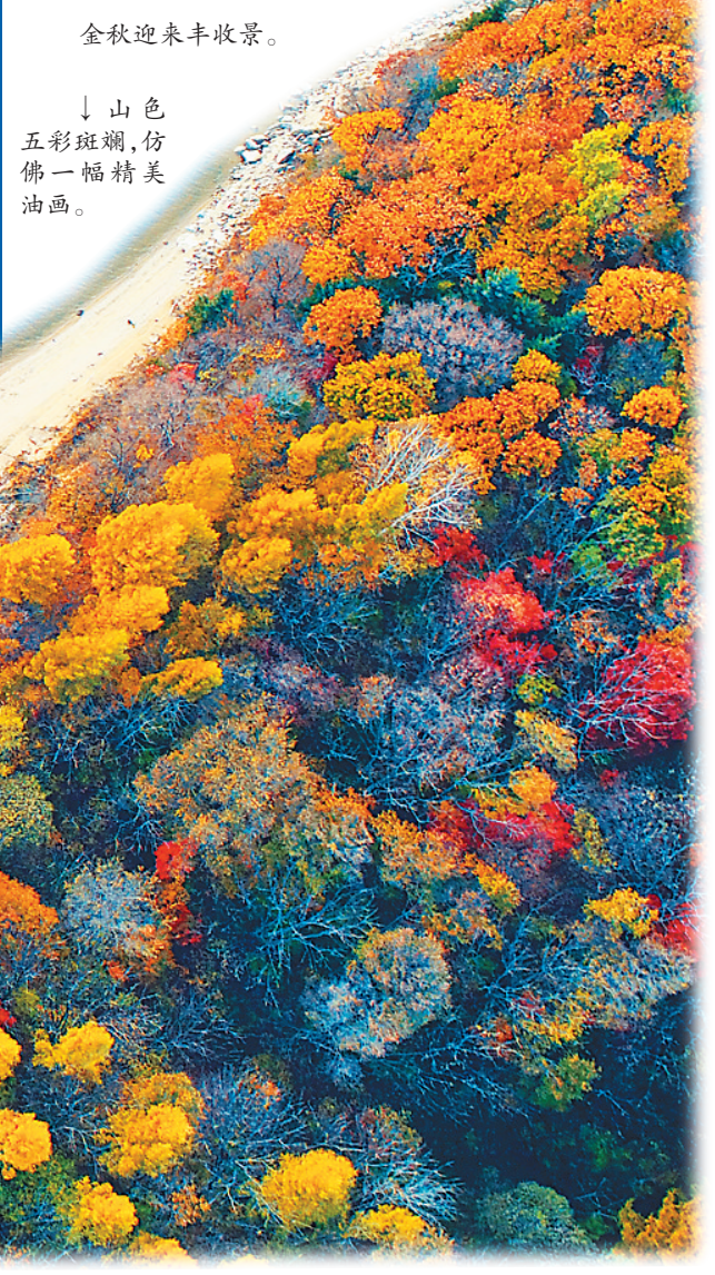
↓ 山色五彩斑斓,仿佛一幅精美油画。

主办单位:黑龙江省人民政府新闻办公室 黑龙江日报报业集团 冠名单位:黑龙江省中大路桥集团 执行拍摄:哈尔滨映派文化传媒有限公司 协办单位: 哈尔滨市委宣传部 齐齐哈尔市委宣传部 牡丹江市委宣传部 佳木斯市委宣传部 大庆市委宣传部 鸡西市委宣传部 双鸭山市委宣传部 伊春市委宣传部 七台河市委宣传部 鹤岗市委宣传部 黑河市委宣传部 绥化市委宣传部 大兴安岭地委宣传部 黑龙江省森工总局党委宣传部 黑龙江省农垦总局党委宣传部