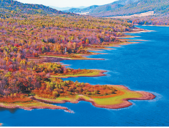
如线条、似画卷,秋水共长天一色。