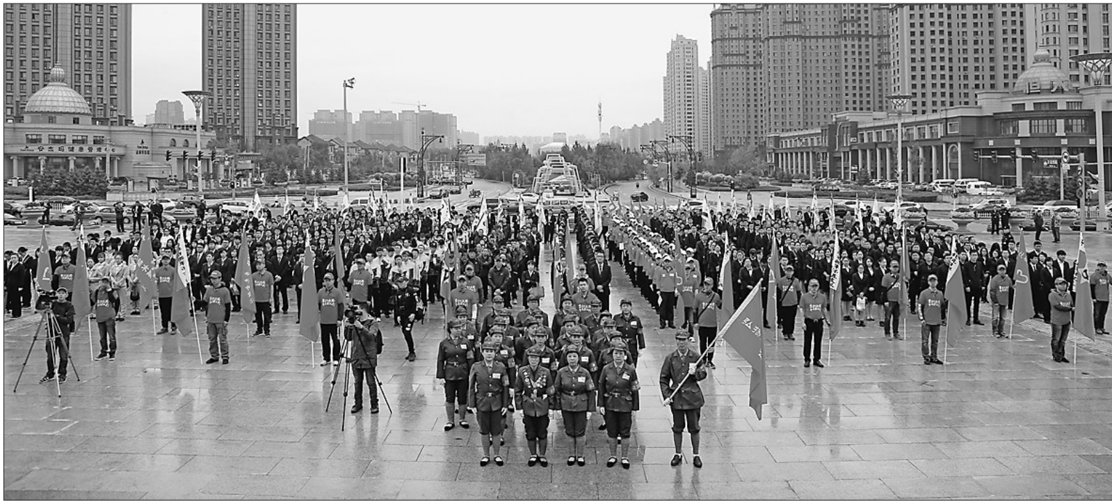
全省各地金融系统深入开展“重走抗联路 普惠金融行”主题实践活动。图为金融志愿者方队。

在王迅看来,要不断提升服务实体经济的效率和水平,全省金融业首先要紧贴实体经济发展需求,准确把握我省经济增长的新趋势和新变化。抓好重点项目资金的对接落实,要结合重点项目清单,整合银行信贷资源,持续开展多种形式的银企“资金对接”,督促指导全省重点项目建设资金及时到位。支持工业经济,继续开展好“金融支持制造业发展服务年”各项活动,全面掌握我省近170户“老字号”工业企业基本情况,有针对性地设计专项金融服务方案,提供综合化的融资支持。依托全省重点产业项目、《中国制造2025》重点项目、资源深加工项目、“双百工程”,搞好重点项目建设融资对接,提高对接效率和资金到位率。支持传统老工业基地振兴,支持资源型城市转型,支持发展新型工业,积极推动资源能源精深加工、工业产业园区、工业一体化项目等领域发展。加快推动权益类资产质押融资工作,以《推进权益类资产质押融资工作行动方案》为指引,结合本地实际,制定相应的工作方案和细则,抓好贯彻落实。根据科技、文化、旅游等轻资产较多的行业资金需求,引导金融机构利用