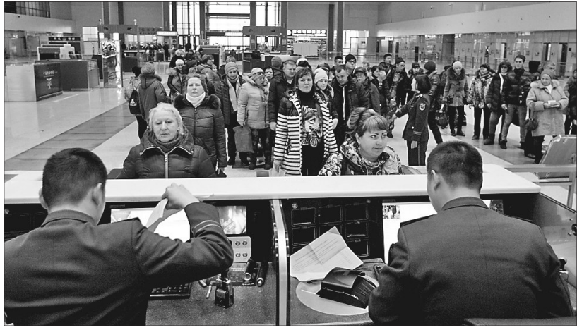
宽敞明亮的公路口岸联检大厅。

为表彰绥芬河口岸联检联运部门良好工作成效,推动口岸工作再上新台阶,促进口岸过货持续增长、对外贸易稳步提升,进一步激发全市各部门、各单位的担当意识和实干精神,绥芬河市委市政府决定,给予绥芬河铁路车站、绥芬河海关、绥芬河出入境检验检疫局、绥芬河边防检查站、绥芬河口岸委通报表彰。希望受到表彰的单位珍惜荣誉、不辱使命、再接再厉,为口岸“大进大出、优进优出、快进快出”提供更加便利、高效、优质的工作举措和通关环境,为促进绥芬河市经济社会发展做出新的更大贡献。