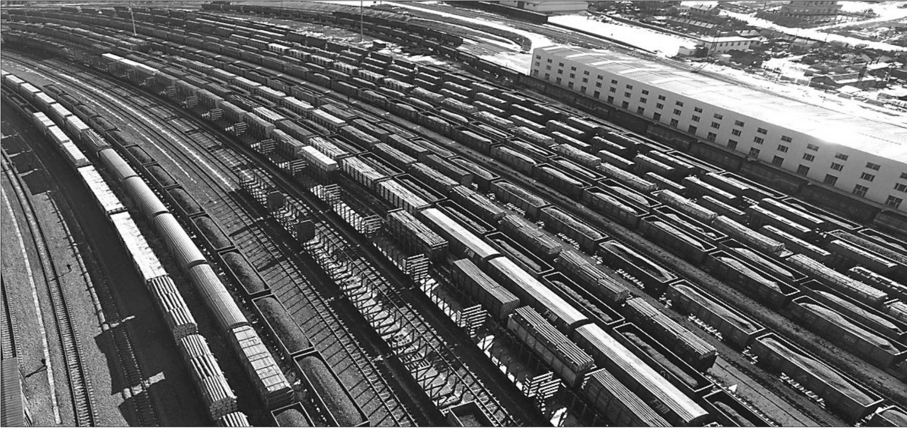
繁忙的绥芬河铁路口岸。