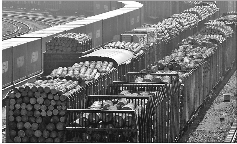
从俄罗斯运进国内的木材专列。