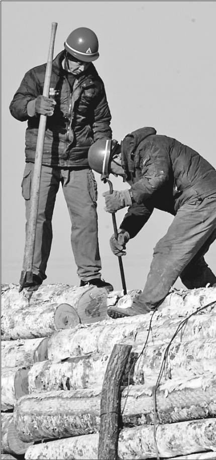
工人正在换装原木。

至5~10分钟。雄关漫道真如铁,而今迈步从头越。年过货千万吨的佳绩,既是绥芬河口岸前行路上的里程碑,更是口岸加快发展的新起点。正如俄罗斯远东铁路局副局长瓦乌林说的那样,口岸过货千万吨成绩的取得,证明中俄双方还有更大的发展空间和发展前景,两国间铁路客运量和货运量将会持续增长。由此看来,加强中俄交流交往,深化口岸合作,不断推动口岸过货量再上新台阶,实现新突破,助推中俄地区间经贸、物流等各领域合作更加高效、便捷,是在新时代必须实现的新目标。有理由坚信,百年口岸绥芬河在未来的发展进程中,必将再次焕发新活力、展现新作为,谱写中俄沿边合作的新篇章。