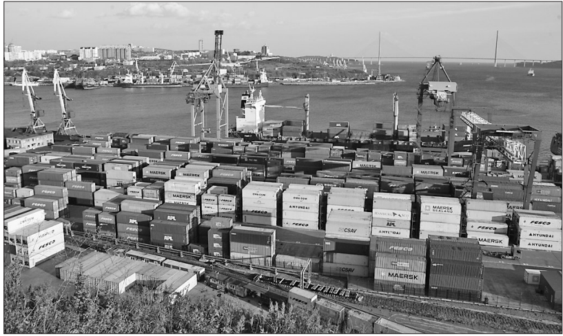
由绥芬河转运至俄罗斯符拉迪沃斯托克港口的货物集装箱等待出海。