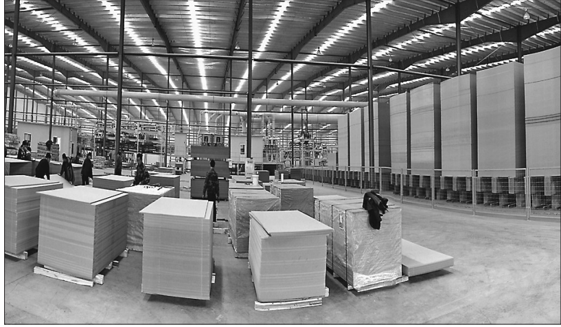
边境经济合作区木业产品等待外运。