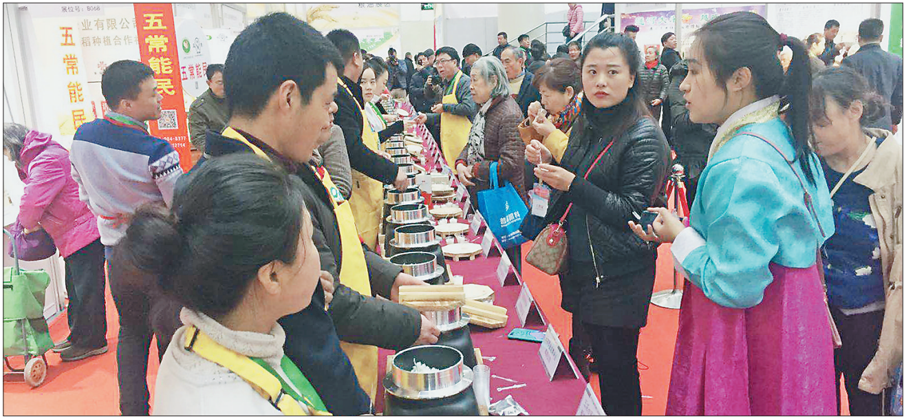
上海市民在品尝现场制作的大米饭。

除了主打产品大米之外,其余的具有浓厚哈尔滨特色的食品也深受广大上海市民喜爱。在裕昌食品的展位前,总是被上海市民围得水泄不通。“这次我们针对上海市民的饮食习惯特意准备的都是小包装,红肠都是一根一塑封,比之前的大