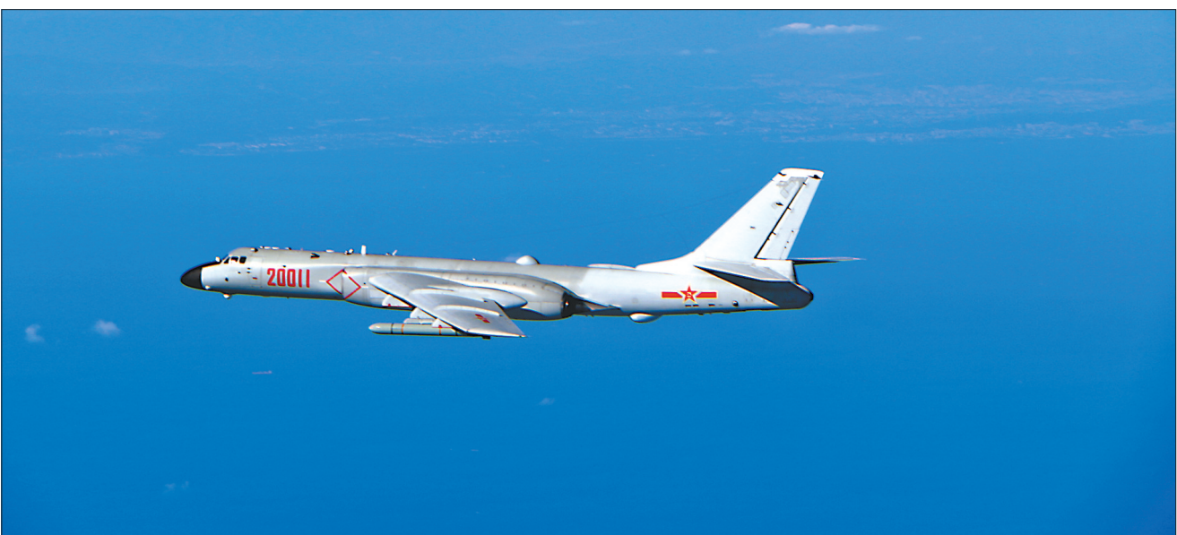
12月18日,中国空军轰—6K战机开展远洋训练。