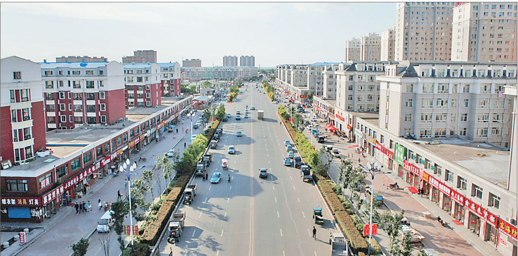
现代有序的城镇风貌。