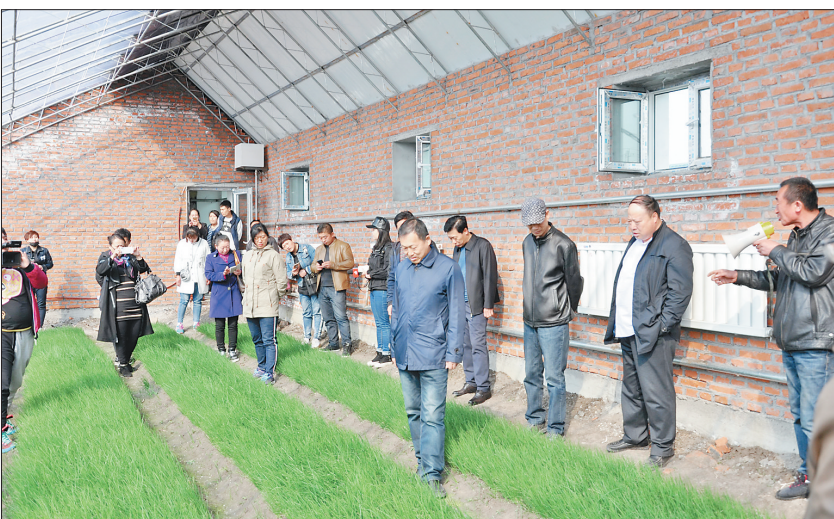
职业农民实训场面。

以完善基础为导向，加大政策投入。完成两区划定。划定粮食(水稻、玉米)生产功能区和重要农产品(大豆)生产保护区404.35万亩，以“两区”片块作为保障国家粮食安全和重要农产品有效供给的基本单元，按照国、省统一要求与标准，进行管理、保护与建设；建设美丽乡村。扎实推进“十百千”美丽乡村建设，打造了福祥“年村儿”等一批典型村。创新农业经营体系，建设了全省首家“稻海田园综合体”万亩水稻公园，被人民日报社《民生周刊》评选为“2017民生示范工程”。完善秧田设施。争取省育秧大棚补贴和国家现代农业示范区以奖代补资金，新建水稻育秧棚1940栋，全市水稻育秧大棚达到4.1万栋，智能催芽车间34座，水稻智能化催芽、工厂化育秧面积达到228.5万亩。推进秸秆利用。依托1086台秸秆粉碎还田机械，实现100万亩秸秆肥料化利用；落实省秸秆压块燃料化利用项目，建成1个秸秆压块燃料加工站，带动全市12万吨秸秆燃料化利用。