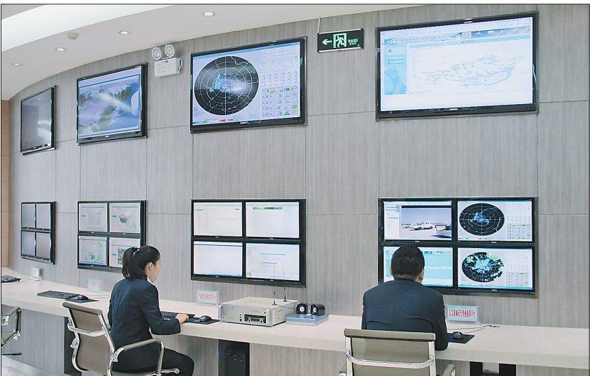
富锦市现代农业综合服务中心。