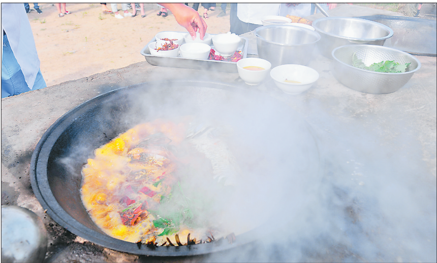
松花江边铁锅炖鱼。