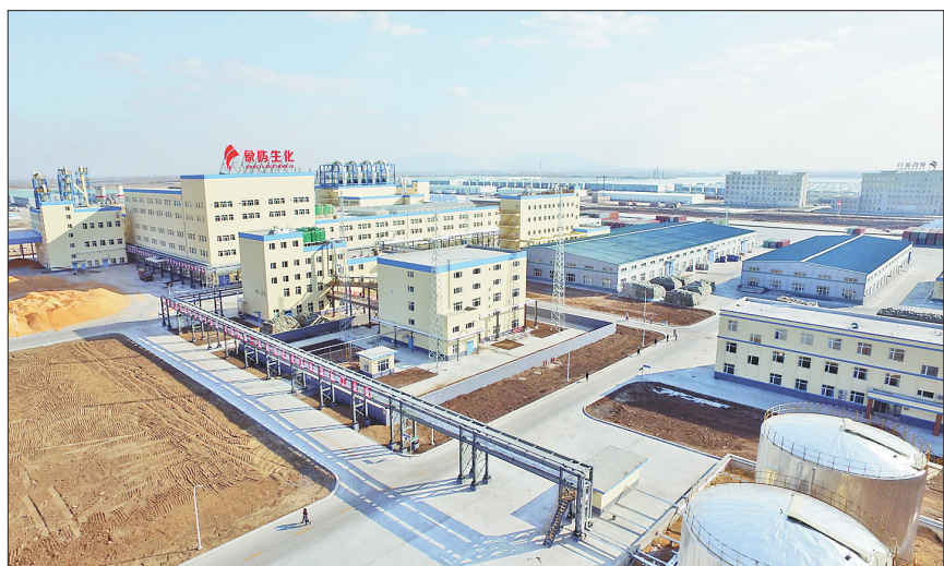
象屿生化淀粉装置区。