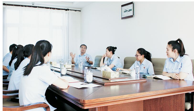
党员常“充电”法官别样红。