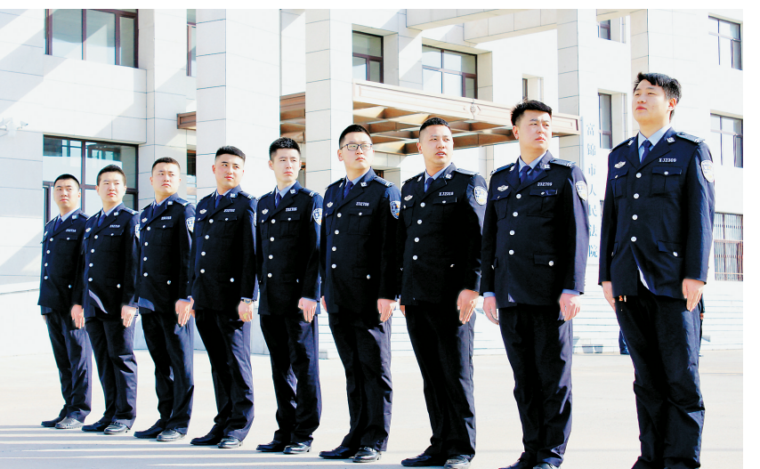
坚持大比武,个个当精兵。