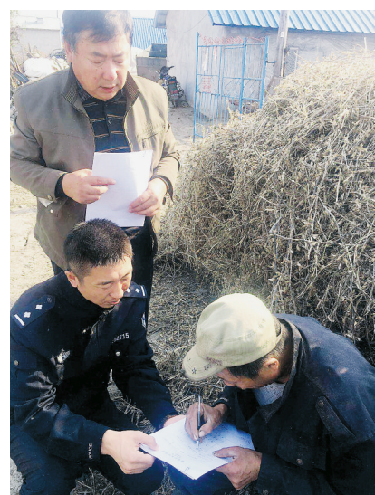
送达法律文书到家门。