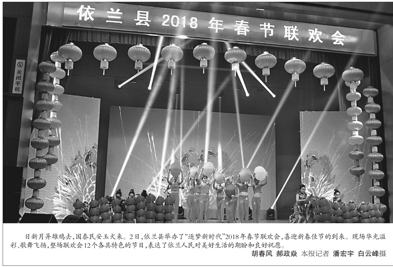
日新月异雄鸡去,国泰民安玉犬来。2日,依兰县举办了“逐梦新时代”2018年春节联欢会,喜迎新春佳节的到来。现场华光溢彩、歌舞飞扬,整场联欢会12个各具特色的节目,表达了依兰人民对美好生活的期盼和良好祝愿。

在县文明办、志愿者协会的统一组织下,巴彦县的16支志愿服务队和业余文艺团体的几百名志愿者,利用春节前这段时间集中开展志愿服务活动,慰问环卫工人、困难群众、留守儿童、空巢老人、五保户、残疾人等群体,为他们送去棉衣、大米、白面、豆油等生活物资,同时开展送药、义诊和慰问演出活动。