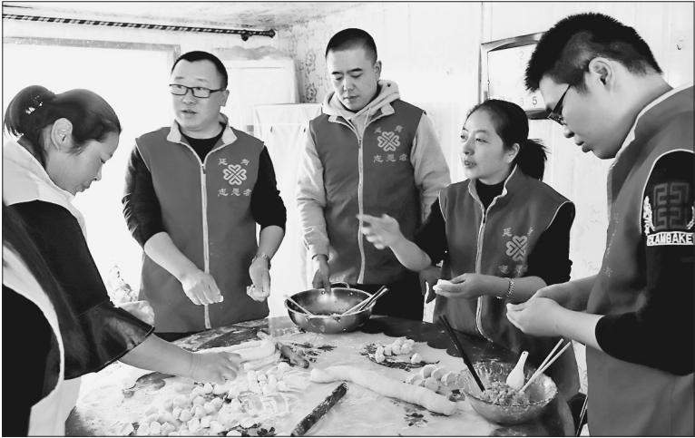
日前,延寿县志愿者协会组织志愿者到六团镇东安村开展“五保老人不孤单、爱心水饺过大年”活动。志愿者们将爱心包进饺子里,让五保老人们感受到社会大家庭的温暖。