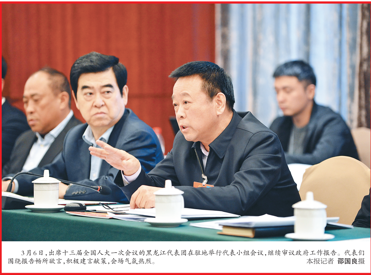
3月6日,出席十三届全国人大一次会议的黑龙江代表团在驻地举行代表小组会议,继续审议政府工作报告。代表们围绕报告畅所欲言,积极建言献策,会场气氛热烈。