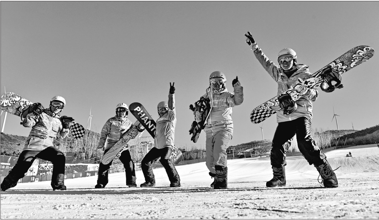
奥悦碾子山国际滑雪场。

齐齐哈尔市碾子山区拥有得天独厚的自然资源:地处大兴安岭东麓余脉,前有大草原,背靠大湿地,左有阿尔山、柴河国家风景区,右有世界火山地质公园五大