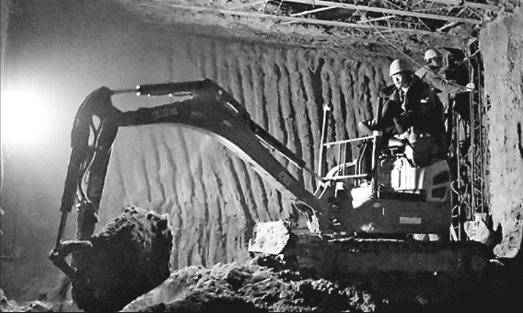
由中国水电四局承建的哈尔滨市地铁2号线省政府站自2月20日复工以来,施工进展顺利。据了解,省政府站至衡山路站区间左线盾构已贯通,施工人員正在进行站台层土方施工。

亩的任务。此外,将结合黑土地保护、发展绿色有机农产品生产,组织种植大户、农民专业合作社等经营主体利用秸秆制造有机肥,持续加大对工厂化造肥企业支持力度,不断扩大企业规模和数量。力争今年全市秸秆肥料化利用达到810万吨以上;在能源化利用方面,哈市将通过秸秆压块燃料化利用和秸秆发电、秸秆沼气等项目不断加快能源化利用进程。在省确定的秸秆综合利用试点县(市、区)基础上,增加投入,逐步扩大秸秆压块燃料化利用试点范围,带动推广生物质节能炉具。