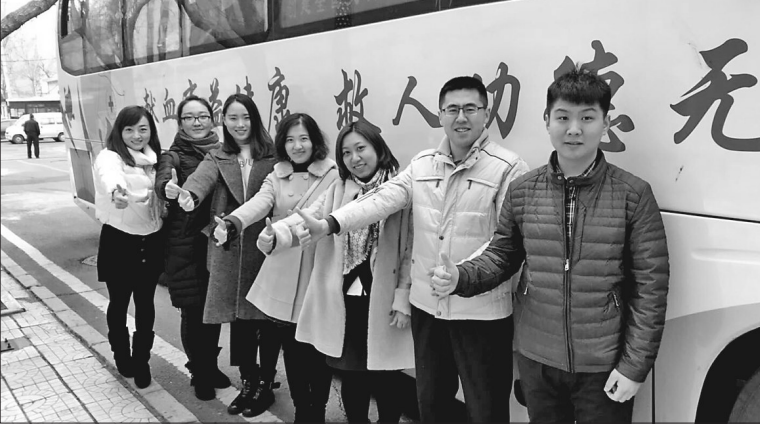
3月14日,工商银行哈尔滨分行团委与哈尔滨市血液中心开展“无私奉献,不忘初心,挽救生命,砥砺前行”大型公益献血活动。400余名员工400多颗爱心,献血93170cc,传递了正能量,用实际行动诠释了工商银行的社会责任担当。

今年,哈市将进一步完善“社保综合柜员制”,开发“五险综合服务体系”,实现窗口功能合一、经办同步、集成服务、受办分离,全面实现“一号申请、一窗受理、一网通办”,进一步方便办事单位及群众。完善“哈尔滨智慧人社”手机APP网上经办及缴费业务,增设社保经办、劳动关系、就业创业、人事人才等相关业务模块。扩大社会保障自助服务终端一体机覆盖面,实现进社区、进医院、进药店目标。加快推进完善异地结算平台结算系统及预付金测算系统建设,加强与省级平台、各县(市)平台互联互通,及时有效解决参保患者异地就医刷卡入院、出院结算等问题。尽快实现“先看病、后付费”功能模式的推广应用,以更加人性化服务为市民提供便利。加大医保扶贫力度,人社系统与民政系统、商保机构信息系统智慧衔接,实现建档立卡贫困人口基本医保、大病保险和医疗救助“一站式”直接结算,确保目录内报销比例达到95%。