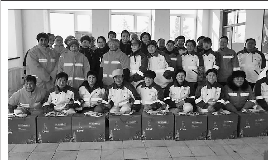
巴彦县妇联开展“送温暖 献爱心”活动,为环卫女职工送去了毛毯等慰问品,她们为城市环境整洁的付出和奉献致以真挚的感谢。 王晓东 本报记者白云峰摄

推进农业与旅游产业融合。围绕“国家全域旅游示范县”创建,围绕英杰、大顶山、永和、香炉山、长寿山5条休闲农业与乡村旅游精品线路建设,带动沿线发展农家乐、农事体验、共享农庄等项目,吸引周边农户参与务工、流转土地,实现增收。同时,大力开展“旅游+电商”营销模式,借助中间力量,激活旅游市场,扩大休闲农业与乡村旅游综合收入。