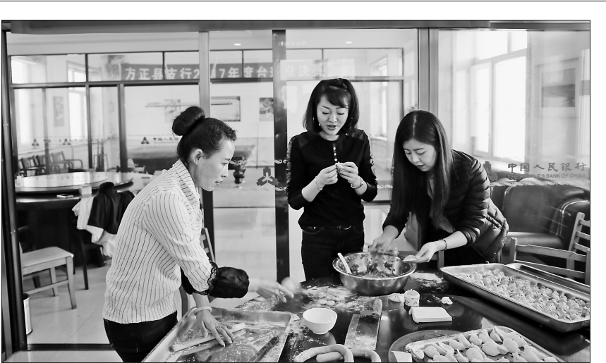
人民银行方正县支行举办了“彰显魅力女性不负新时代使命”座谈会和女职工包饺子比赛等系列活动,展示出女职工的新时代风采。赵岩峰 本报记者 白云峰摄