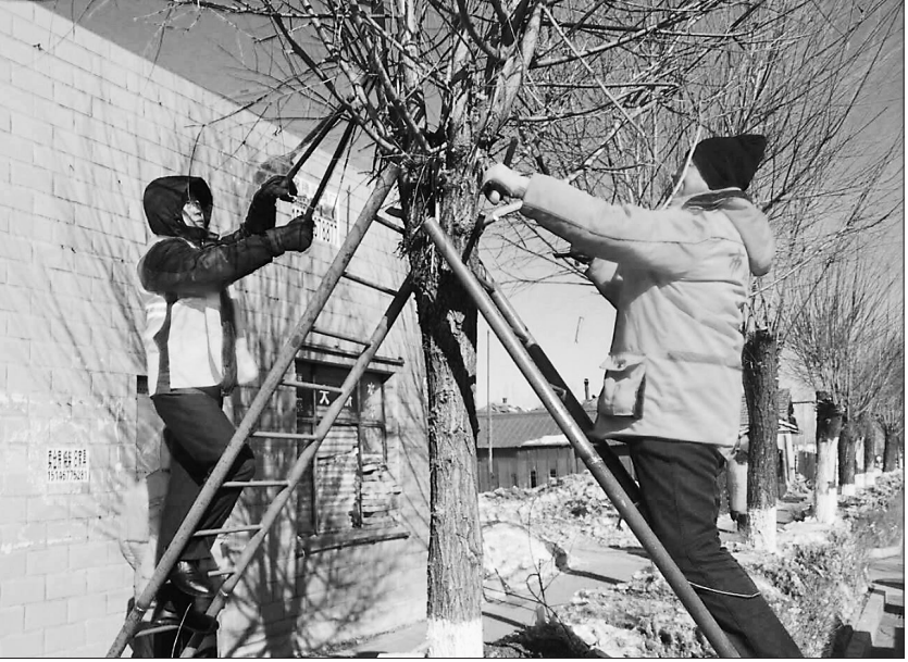
东方红重点国有林管理局对局址地区绿化树木采取拉网式整体修剪。马洪亮 本报记者 马一梅 赵辉摄