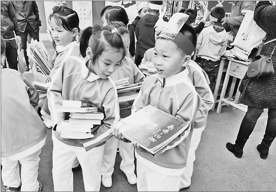
哈尔滨市闽江小学的孩子在为希望小学捐书。