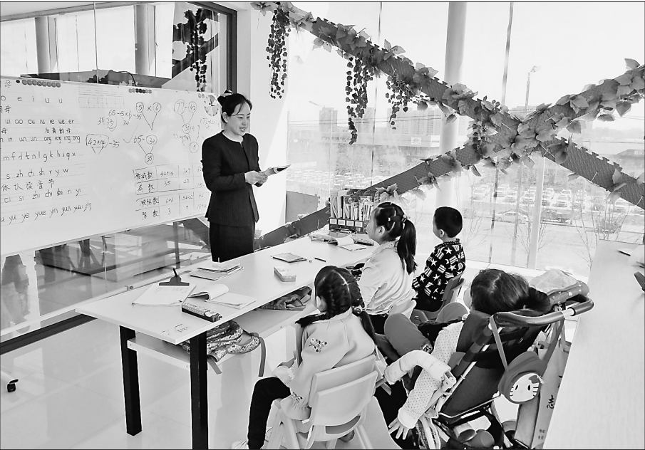
哈尔滨博能脑瘫患儿康复中心的老师在为孩子们读故事。