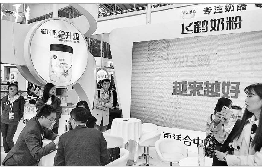
产品展位前消费者正在咨询。

质筑基,源头布局,守住品质建设“生命线”。民族乳业要稳扎稳打,夯实品质根基,高质量发展阶段的根基就是“安全”和“高品质”。飞鹤乳业历经十年,在这条珍贵的黄金奶源带上打造了中国婴幼儿奶粉行业第一条完整的全产业链,对整个产业链的各个环节都以最严、最高的标准来对标,确保了产品品质。企业最大的诚信,就是履行对消费者品质安全的承诺。对于品质的追求,既是企业发展的现实需要,更是每一个企业员工对社会责任担当和承诺。确保产品品质,进而树立品牌自信,需要坚守、信任和情怀的力量,更有赖于企业家精神、工匠精神和集体责任感的保驾护航。“稳”中求“变”,方可开拓出新路,激发出更大生机,只有创新驱动,才能实现弯道超车。冷友斌表示,民族乳业要从“站起来”迈向“强起来”,就要在稳中求变,要聚焦核心资源与优势,探索更高质量的产品。多年来,飞鹤乳业以市场为导向,专注于婴幼儿奶粉领域,立足于中外宝宝的体质差异,积极构建以企业为主体、产学研深度融合的技术创新体系,以中国母乳为“黄金标准”进行研发,注重培育和增强集突破性、引领性、平台化于一体的创新能力,不断创造和生产出“更适合中国宝宝体质”的奶粉。如果说“稳”是品质筑基,“变”则是品质升级,是实现民族品牌持续健康发展的必由之路。民族品牌的应时而变,既是消费升级的时代命题,也有中国乳业消费潜能与内驱力的主体诉求。面临逆全球化和贸易保护主义的杂音,中国企业更要锐意进取、埋头苦干,弘