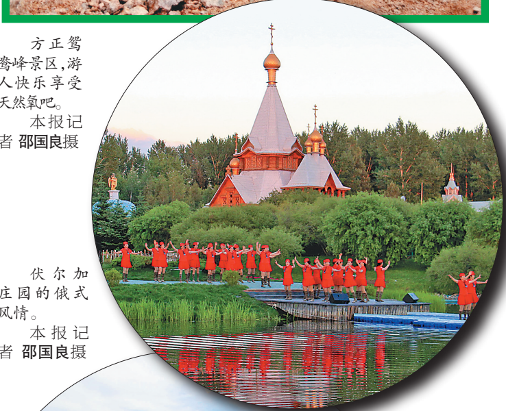
伏尔加庄园的俄式风情。