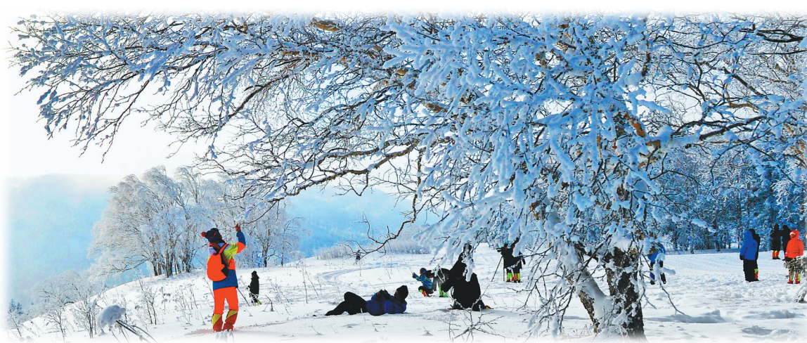
凤凰山高山大平台上的雾凇美景。