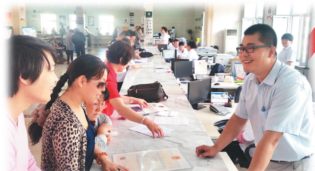
宽敞明亮的办公大厅。

省直机关开展“四零”承诺以来,窗口单位站在了“最前线”,每个部门、每个单位、每个责任人,都时刻铭记自己肩上的担子,压实落靠工作责任、转变提升工作态度,不折不扣、一项一项地将承诺兑现,充分发挥“小窗口”的“大作为”,通过以点带面、以上率下,促进服务理念、服务意识、服务方式的深化和变革,使省直机关在作风整顿的锤炼中担当起服务人民群众、推动振兴发展的光荣使命,以诚践诺,取信于民,让群众看到实实在在的成果,为龙江全面振兴发展提供良好环境和有力保障。