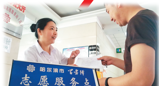
帮助市民解答疑问。