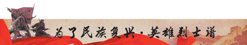
为了民族复兴·英雄烈士谱

1928年1月,在俞昌准等人的领导下,南芜边区苏维埃政府在谢家坝宣告成立,这是在大革命失败后,安徽诞生的第一个红色农民运动政权。随后,俞昌准领导发动的南芜边区农民武装暴动,犹如一声春雷响彻南芜边区,极大地鼓舞了革命士气,有力地打击了地方反动势力的嚣张气焰,为安徽省农民革命运动树立了一面光辉的旗帜。