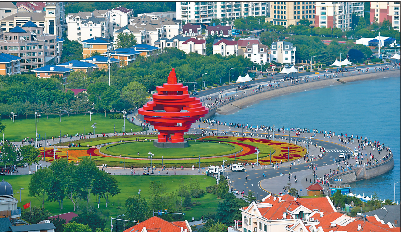
这是青岛五四广场。