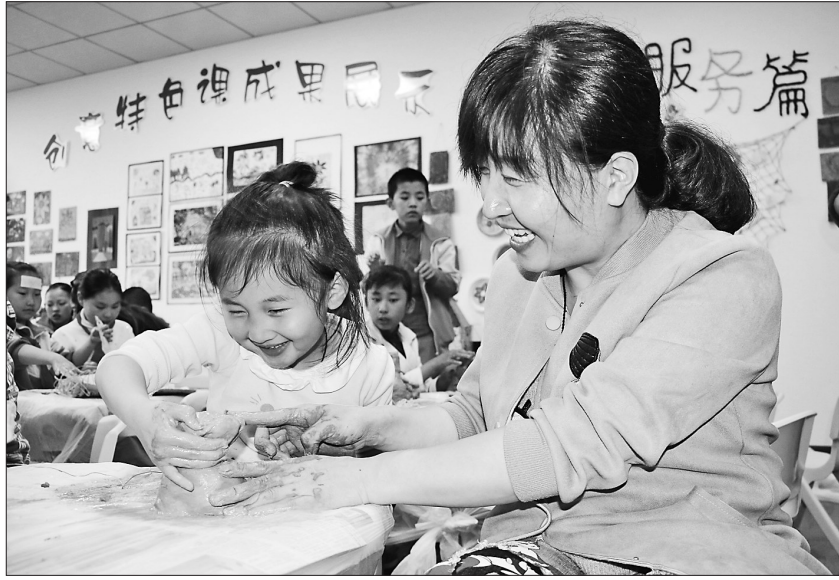
伊春区青少年活动中心举行“迎六一大手牵小手”亲子系列活动,通过亲子互动和游戏搭建校外教育与家庭教育的桥梁,增进亲子之间的感情。

一个个项目,不断夯实产业基础;一次次提质增效,悄然调整产业结构。招商引资正为汤旺河不断注入新鲜血液,带来澎湃动力。不久的将来,招商落地项目将成为汤旺河转型发展的新引擎。