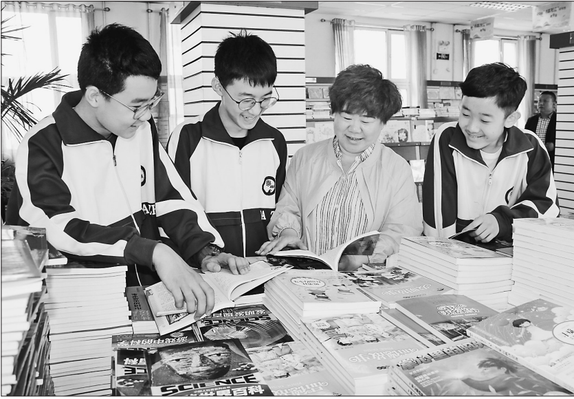
为丰富中小學生假期生活,伊春市开展了主题阅读活动,全市共有79位导读教师走进新华书店,现场为同学们进行阅读指导。