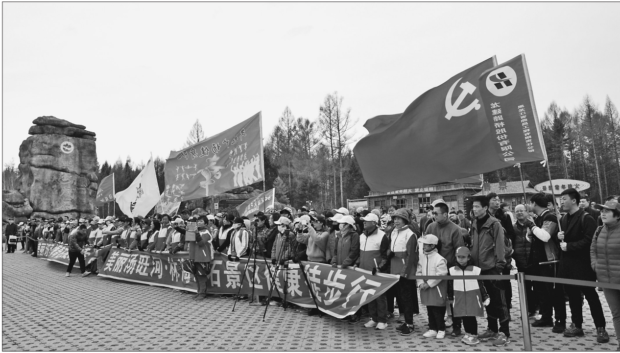
旅游业是汤旺河区招商引资的热门项目。

哈尔滨春天教育产业集团落户汤旺河,仅用一个多月的时间规划了“伊春冰雪书画小镇、伊春森林温泉度假酒店和伊春蓝品森林食品加工”三个项目,计划用3年时间分三期投资10亿元在汤旺河打造文化旅游健康休闲及森林食品加工与研发综合体项目;黑龙江鑫泰隆旅游开发发展管理有限公司来了,汤旺河人又是一番努力后,企业决定在汤旺河区投资5100万元建设IBOX集装箱旅游度假综合体项目。据了解,这些项目建成后,盘活了闲置的固定资产,进一步提升了城镇品位,改善了当前经济发展运行的格局,促进了就业,将进一