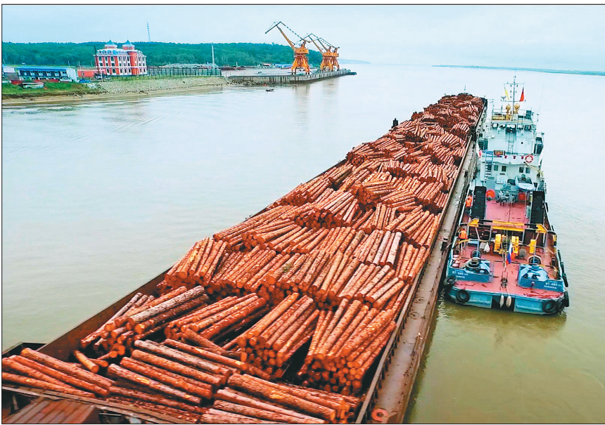
从俄罗斯进口的木材抵达抚远莽吉塔港。

签署了合作协议，一个月后，一期工程“黑龙江省抚远港务局原粮食码头修复工程”正式开工。