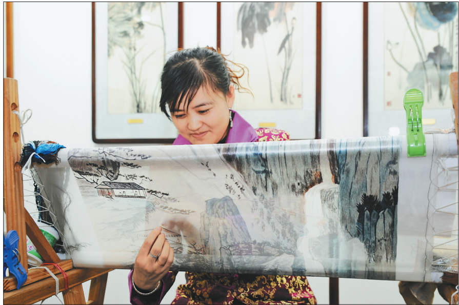
林口蚕翼绣入选省级非遗名录。