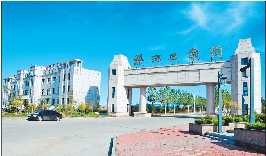
林口县经济开发区。