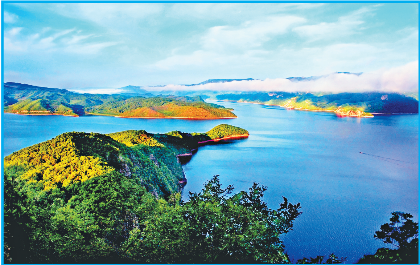
风光秀丽的莲花湖。