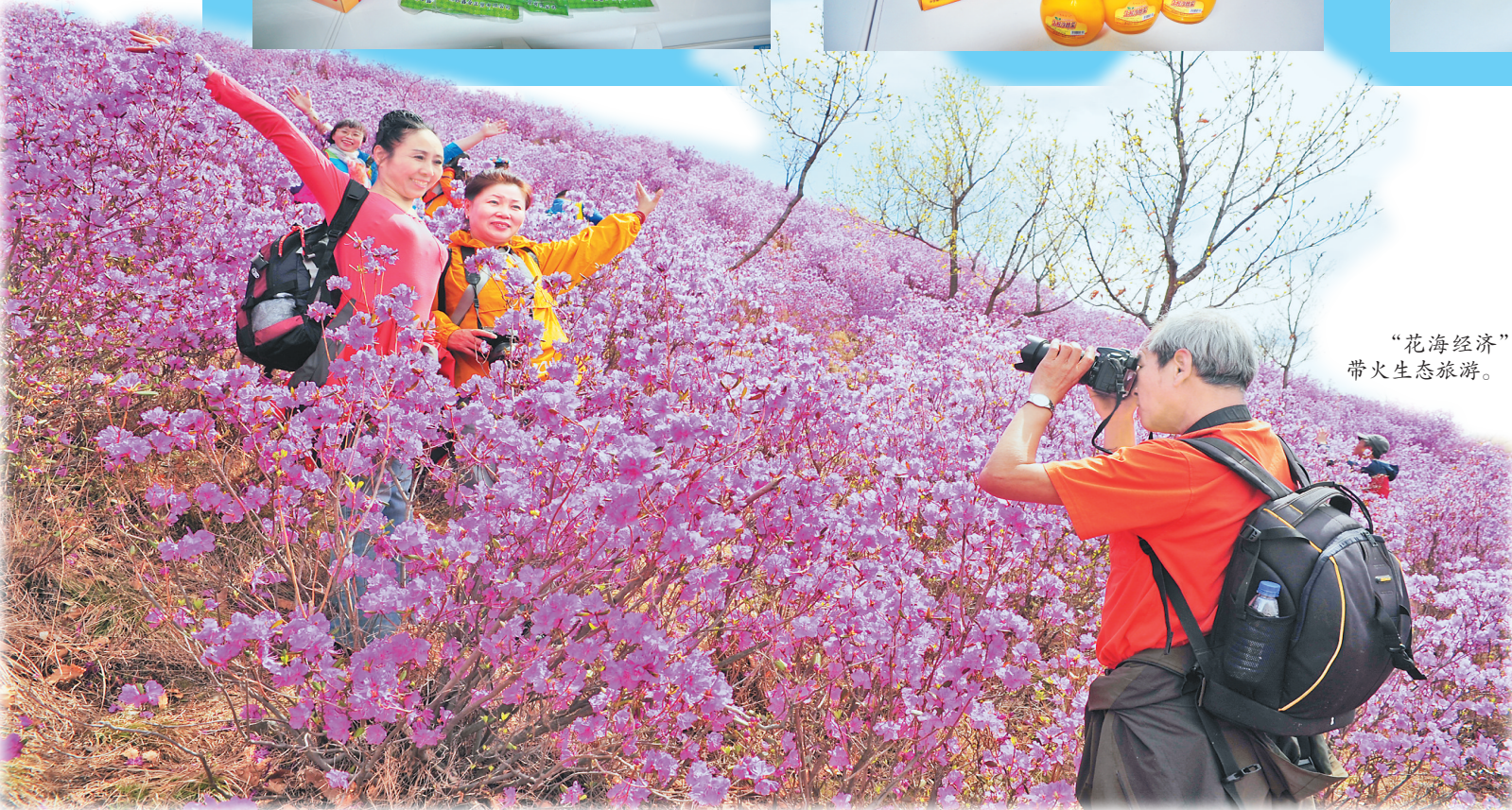
“花海经济”带火生态旅游。