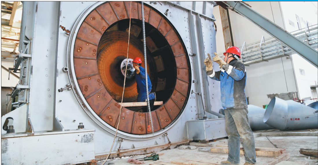
神华国能宝清煤电化项目现场工人们正在安装磨煤机。