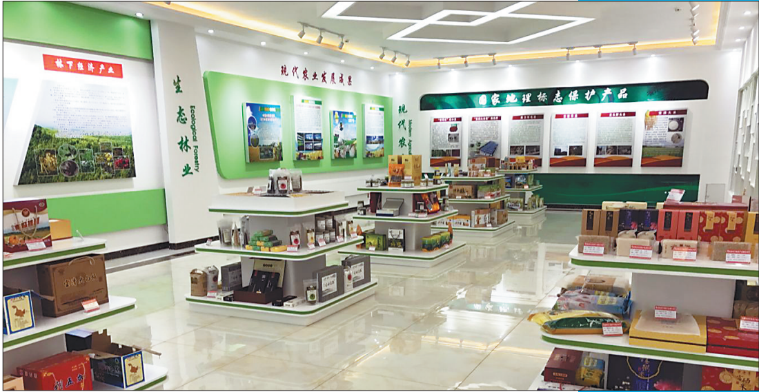
电商产业园区产品展区。

宝清县还制定了《2018年全县政府失信违诺专项治理工作实施方案》,以持续整顿“三个坏把式”“五个坏作风”为切入点,聚集形式主义、官僚主义等“四风”新表现,针对政府失责失信影响营商环境的突出问题,开展专项清理整顿。