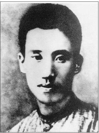
彭湃像(资料照片)。

作后,彭湃以国民党中央农民部特派员身份到达广宁,领导开展广宁农民反对地主武装的斗争。1925年2月,彭湃参加东征。