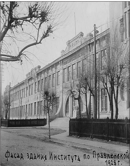
中俄工业大学校舍。

1945年8月,抗日战争胜利后,哈尔滨工业大学由中长铁路局领导,属中苏两国政府共同管理。1950年6月7日,哈尔滨工业大学被中国政府正式接管,此后得到国家大力支持。1954年,哈尔滨工业大学成为首批全国重点大学。