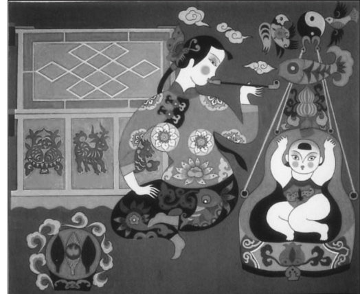
早年东北女人的长烟袋。

基本上,半大孩子就会敲鼓捣烟。甚至,在炕上爬的娃娃也敢鼓捣烟。小孩子不会抽,却会抓烟叶往嘴里放,虽然辣得龇牙咧嘴、哇哇乱叫,却尝到了烟的滋味。从而,在潜移默化中变成了铁杆烟民。女孩子抽烟也不算啥稀奇事,东北三怪里就有描述:“窗纸糊在窗户外,姑娘叼着大烟袋,养个孩子吊起来”。一般情况下,为了干活方便和携带省事,男人多用半尺长的短烟袋,烟袋短,烟袋锅可一点不小。抽烟时,油光发亮的烟口袋就吊在烟袋杆上,如果男人掉了颗门牙,就常常有人开玩笑说:“嘿嘿,门牙又被烟袋给坠掉了吧!”过足了烟瘾,烟袋锅在鞋底上一磕打,收紧烟口袋绳,全套烟具往衣兜里一揣,或者往后腰沿上腰带里一别,特别方便。