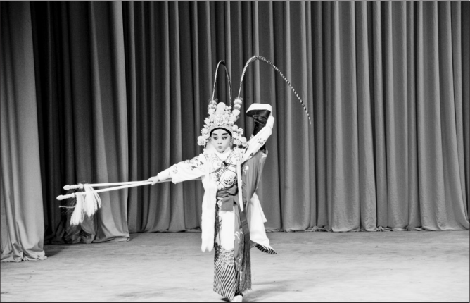
“看我的武功!”