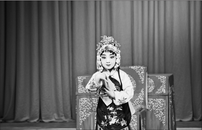
“小梅花奖”评选活动中,小选手的“范儿”。