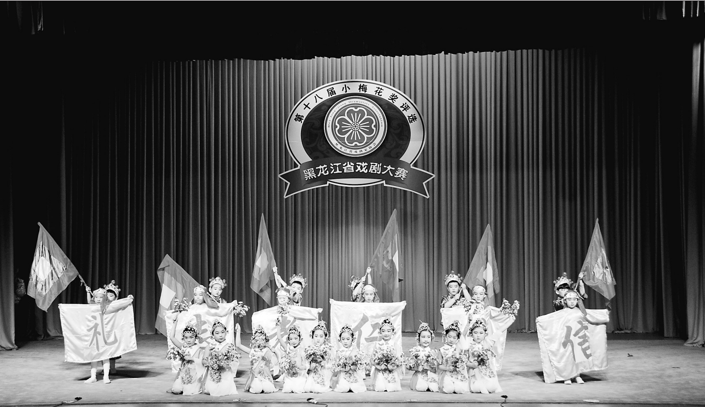
第十八届“小梅花奖”评选活动中,戏曲“小豆丁”精彩的集体节目表演。