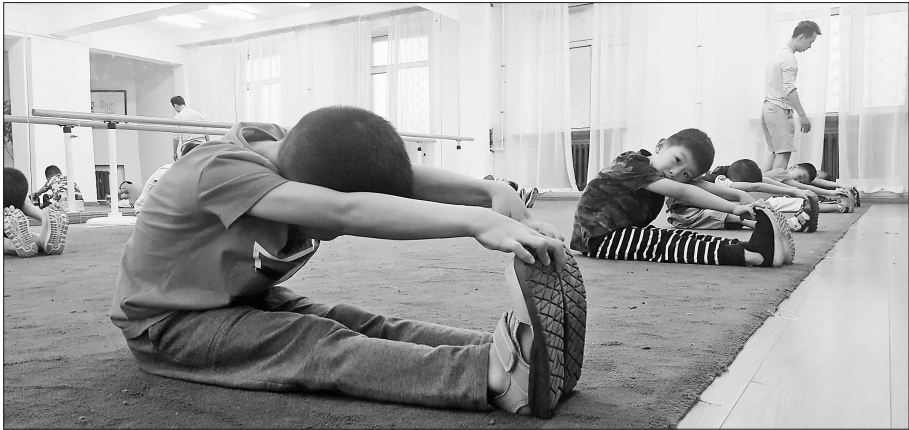
省文联戏剧培训基地课堂上,孩子们在老师指导下认真练功。