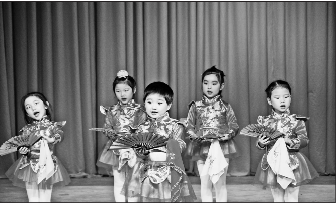
第十八届“小梅花奖”评选活动中,小朋友们出色的表演。