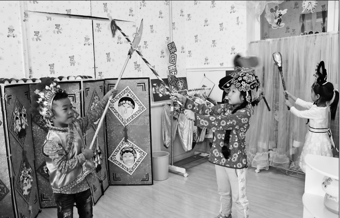
哈尔滨市政府机关第一幼儿园的孩子们在幼儿园的区角活动中感知京剧艺术。