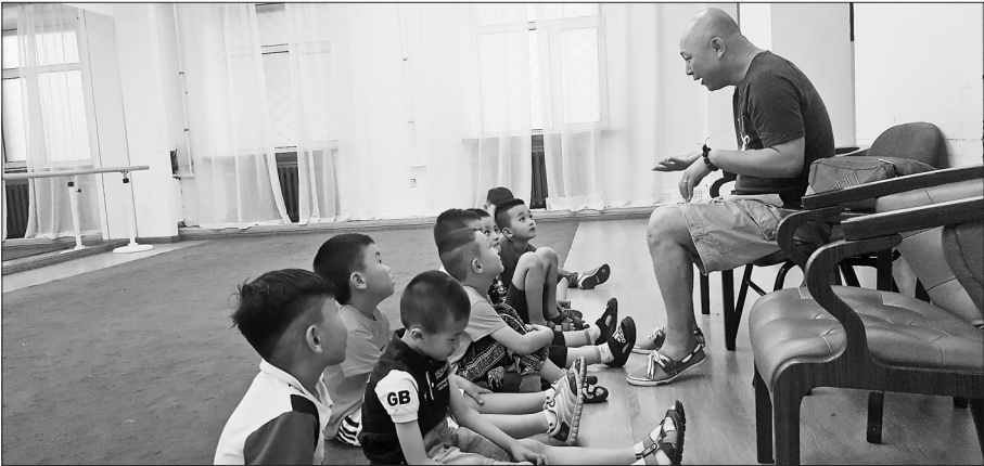
省文联戏剧培训基地的课堂上,老师为孩子们讲述戏曲故事。