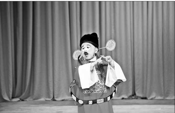
第十八届“小梅花奖”评选活动中,可爱的小选手专注地表演。