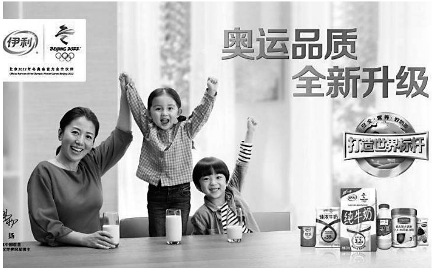
伊利成为中国的“双奥”健康食品企业。