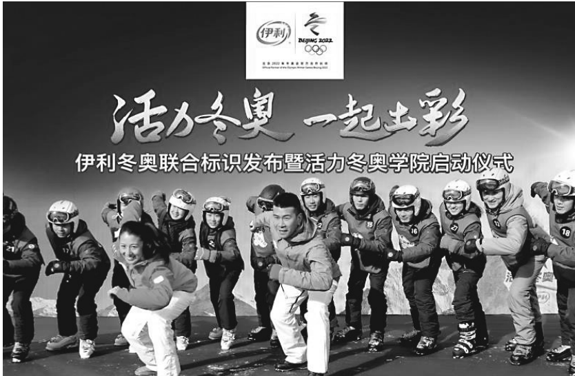
伊利积极推广冰雪运动,助力“3亿人上冰雪”。

“伊利时间”,众多嘉宾见证了伊利与奥运之间的新情谊。在全球乳业的竞技场中,与奥运相伴的伊利正向着“五强千亿”的目标加速度奔跑。