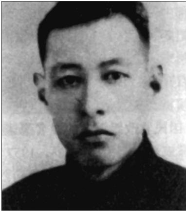
柳直荀像(资料照片)。

在此期间,党内和根据地内“左”的错误方针和政策发展起来,柳直荀因坚决反对,于1932年春夏间被撤销了在党和红军中的领导职务。1932年9月,柳直荀遇难牺牲,时年34岁。1945年4月,中共中央给柳直荀平反昭雪,追认为革命烈士。 1957年5月11日,毛泽东复信柳直荀夫人李淑一,并附《蝶恋花·答李淑一》词一首,“我失骄杨君失柳,杨柳轻飏直上重霄九”,表达了毛泽东对柳直荀的怀念之情。