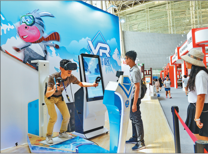
VR亲身体验让观众大地“套圈”。