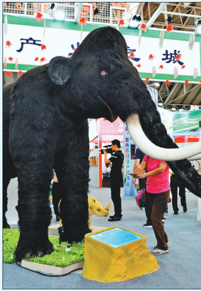
冰川时期的猛犸象走进文博会。

“1958年,青冈县在昌盛乡宏伟水库(当时属于芦河镇境内)首次发现猛犸象门齿化石,时至今日已经出土各类化石总量达十万件以上。”绥化市青冈县委宣传部文艺处佟易林告诉记者,2015年12月22日在青冈古生物化石自然保护区内,又发掘出大量猛犸象等第四纪古生物化石,其中包括象牙两根和鹿骨化石等,使以猛犸象为代表的古生物化石埋藏和分布区域的推断得到了充分验证。