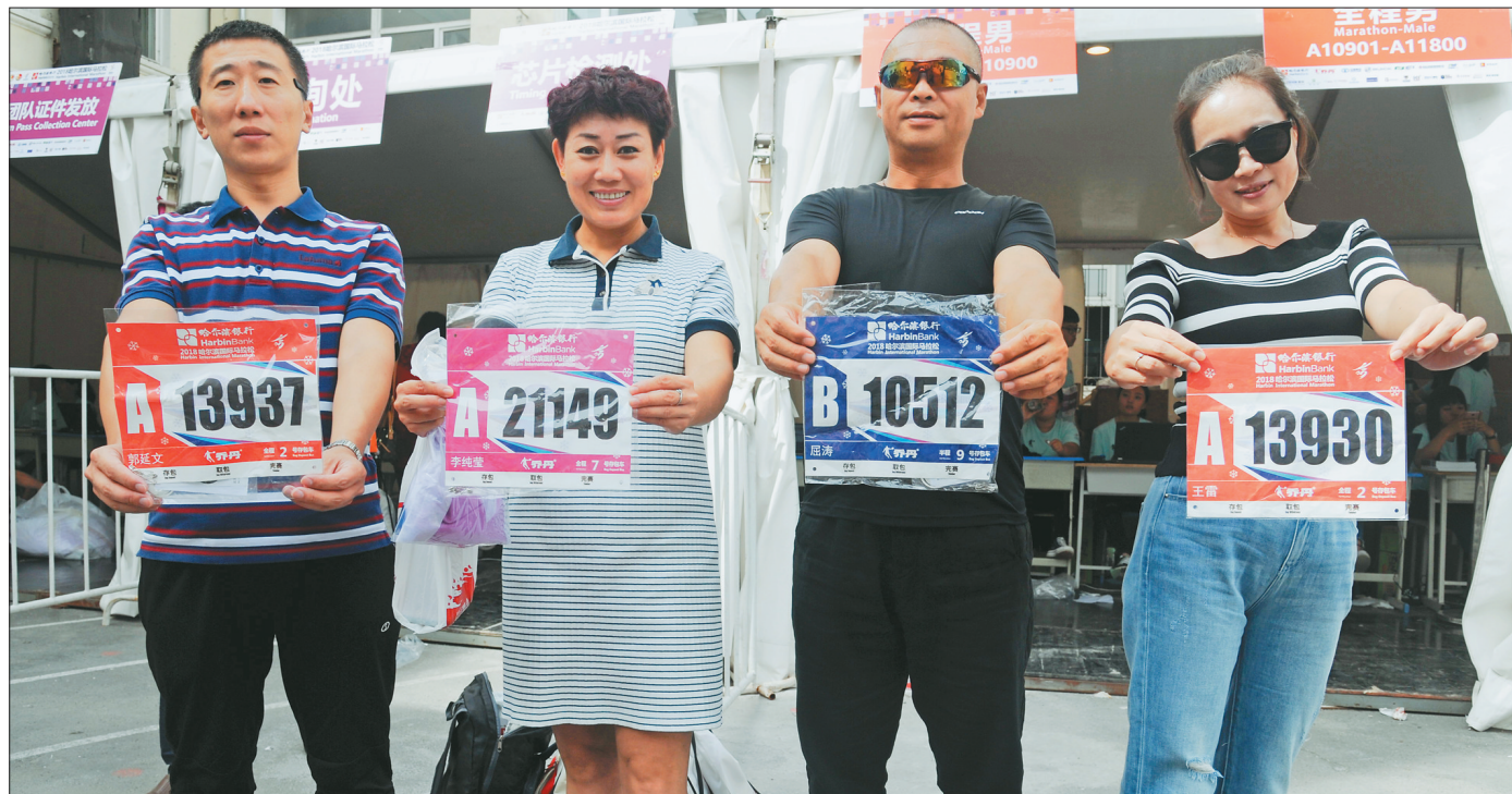
哈尔滨国际马拉松参赛者23日开始在江沿小学(哈尔滨市道里区西头道街57号)领取装备。几位参加马拉松和半程马拉松的选手在现场展示号码布。

本报23日讯(张杰志 记者刘莉)哈尔滨国际马拉松比赛进入倒计时,为确保“哈马”成功举办,日前,哈尔滨市市场监督管理局、市食品药品监督管理局组成多个专项巡查监管组,深入哈马赛事参赛团队驻地(宾馆)及比赛沿途各类商服企业,开展对商服企业商服质量、商服价格、食品安全和特种设备安全监管工作。 据了解,哈市市场监管局、市食药监局按照市委政府和赛事组委会有关会议精神,在相关处室抽调精干人员,集中组成四个联合巡查监管组,依据市场监管和食药监职责,以哈马赛事驻地、比赛线路及周边旅游和商服企业为重点区域,以规范商服企业经营行为,食品安全、价格行为和电梯等其他特种设备安全为重点内容,采取不间断地巡查监管方式,督促商服企业为哈马赛事提供良好的经营与服务环境,确保哈马赛事顺利举办。