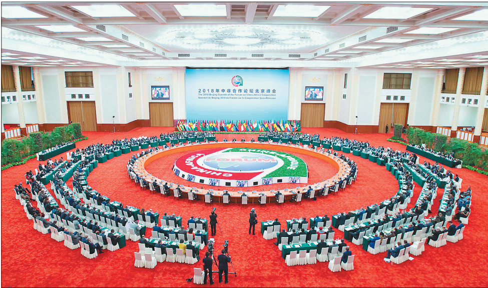
9月4日,中非合作论坛北京峰会圆桌会议在北京人民大会堂举行。国家主席习近平和论坛共同主席国南非总统拉马福萨分别主持第一阶段和第二阶段会议。