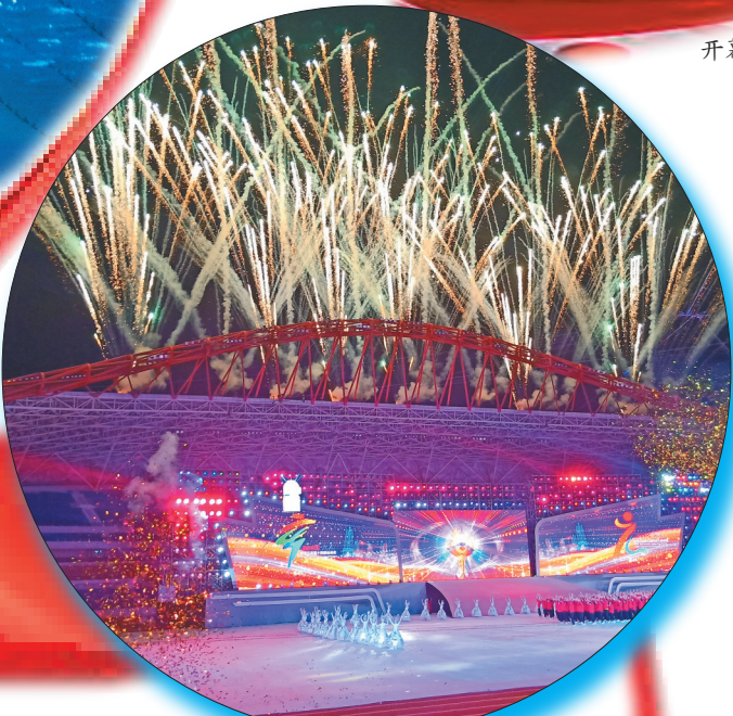
激情省运，豪放大庆。