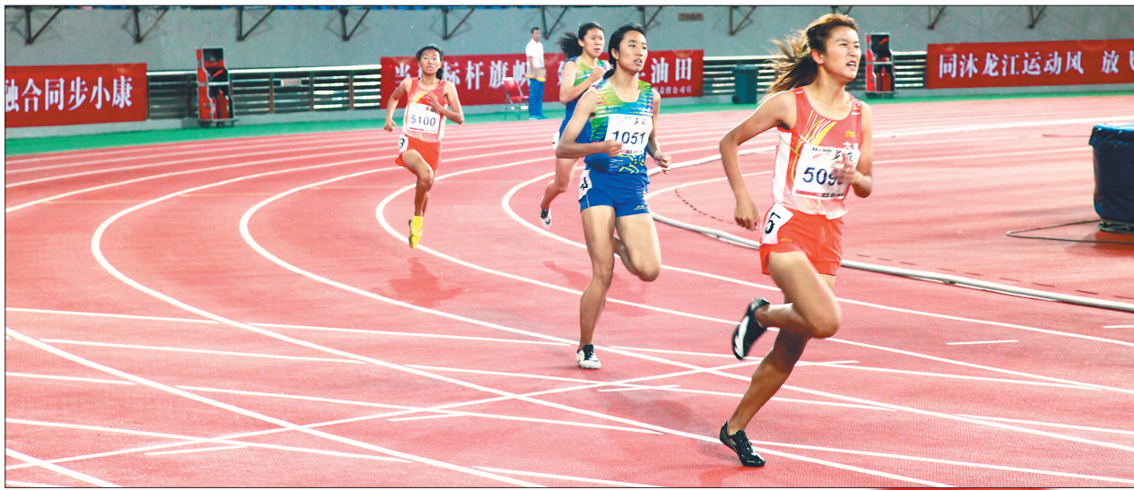
女子400米比赛现场。 马玉龙 本报记者 李飞摄

“这是我见过的最好的比赛场馆，不只是在东北，在全国也很少见。在大庆参加省运会，是一种幸福，也是一种幸运。”记者采访参