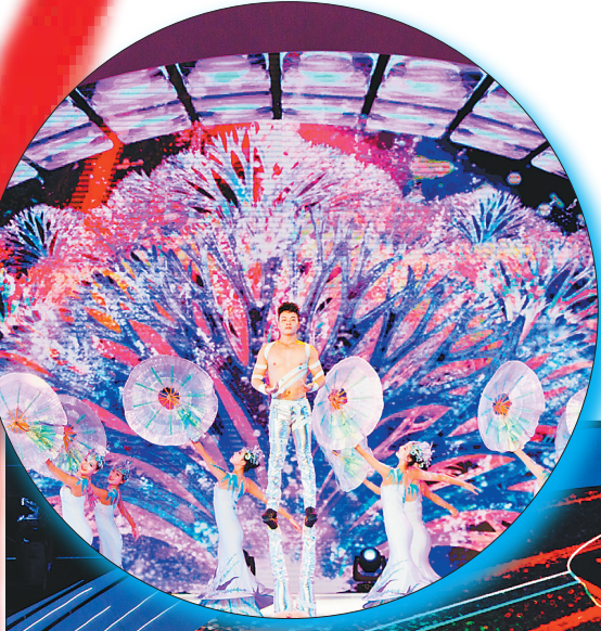
运动人生，动感十足。