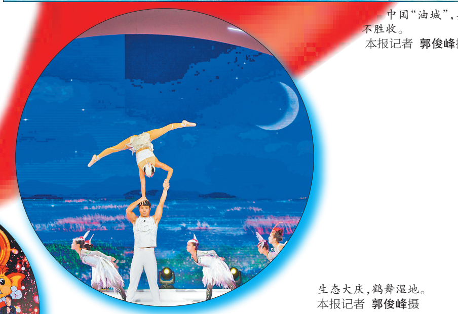
生态大庆，鹤鸣湿地。