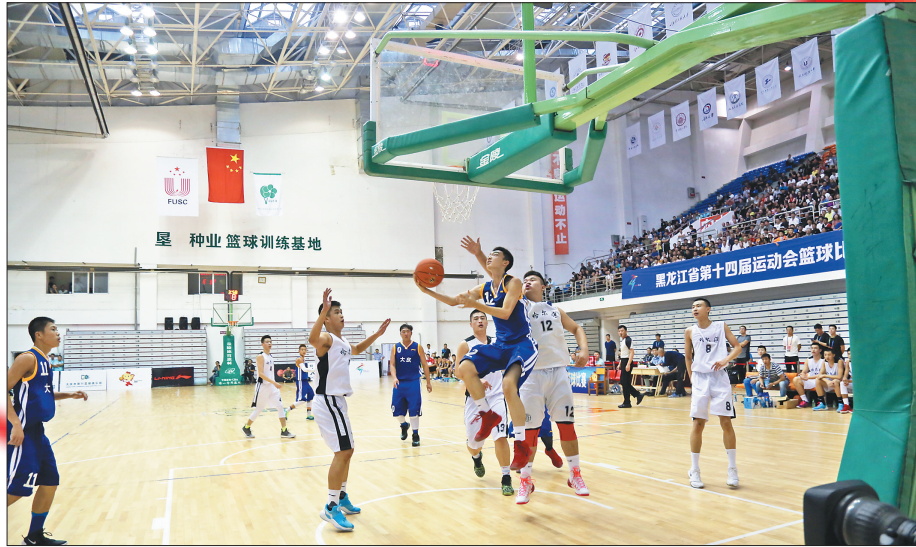
男子篮球比赛现场。 马玉龙 本报记者 李飞摄