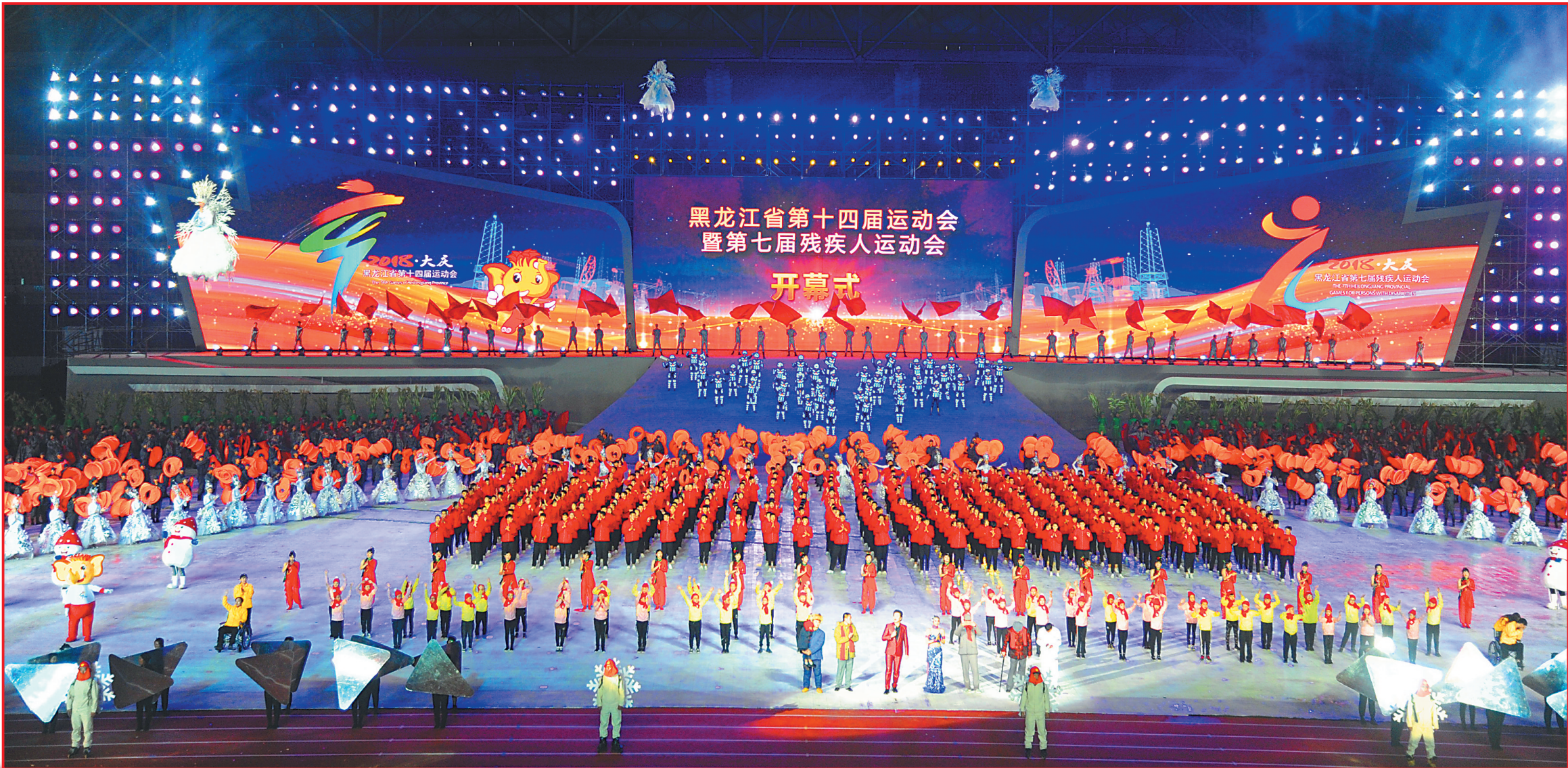
开幕式现场。

文体表演结束后，开幕式举行了火炬传递仪式。来自大庆各行业的5名英模代表高擎火炬，绕场传递，在全场欢呼声中，奥运冠军王镇点燃主火炬，“大庆精神之火”熊熊燃起。