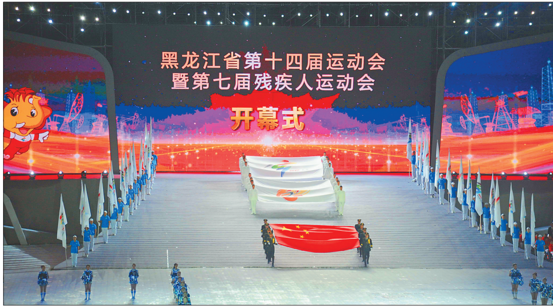
开幕式现场。