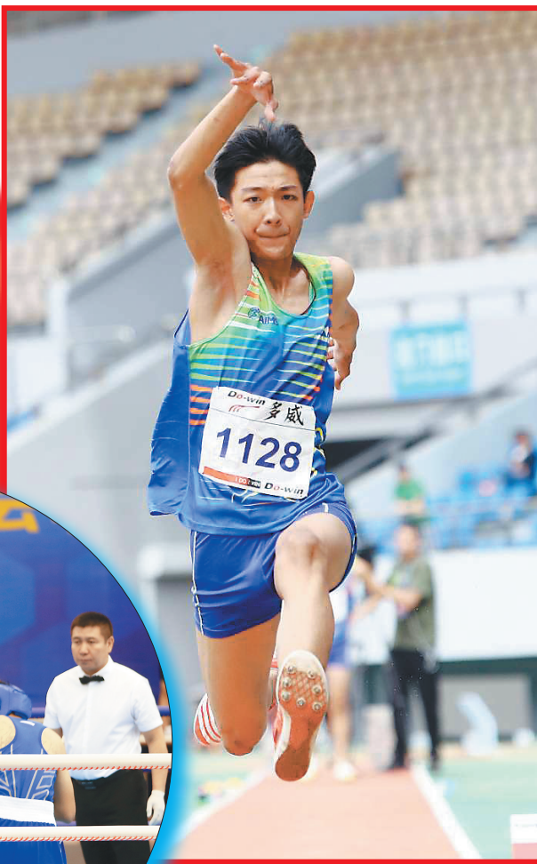
男子跳远比赛现场。