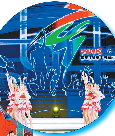
闭幕式演出现场。