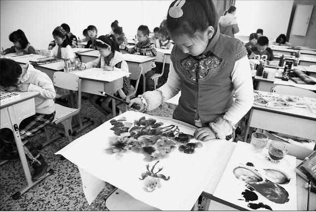
哈尔滨市经纬小学校校园艺术比赛。