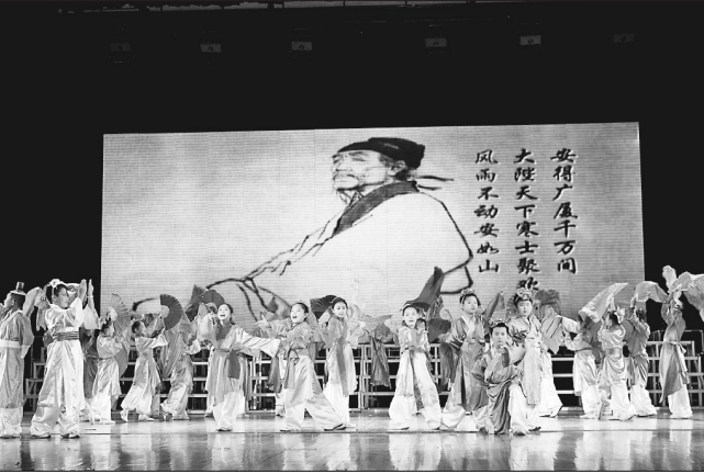
哈尔滨市经纬小学校诵读队诵读国学经典。

课程建设是落实美育的主阵地。虹口区架构区、校两个层面的美育课程体系。区级层面着力打造课程群,让更多的孩子能够在系列课程中,获得持续的感悟和提升。校级层面,鼓励学校结合特色,自主创新。从2015年开始,该区在区级层面启动了一项新的课程——高中学生戏剧进校园课程。“选修一门戏剧课程、学会一项戏剧技能、观摩一场戏剧表演、参与一次戏剧排练、推出一部学生演出的新戏”,通过根植于各高中学校的学生基础以及艺术资源,为学生美育的体验式课程开辟新路径。