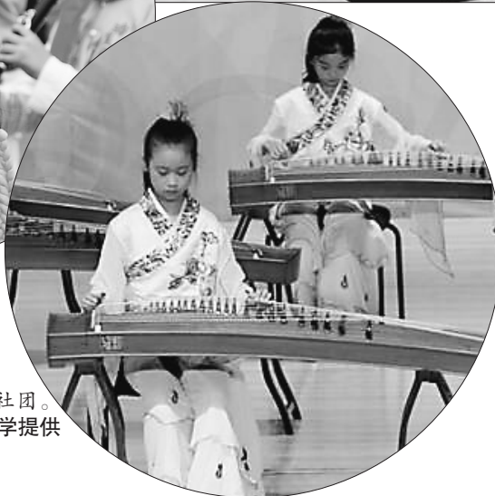
哈尔滨市第十七中学的古筝社团。