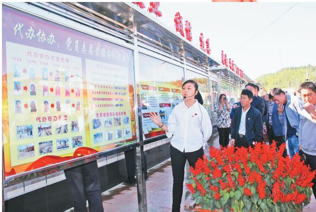
七台河市委连续两年开展基层党建典型现场观摩活动。

七台河市委坚持统筹推进各领域党建工作,在努力实现年末“两新”党组织组织覆盖率达到100%的基础上,积极开展“新时代·党徽在‘两新’组织闪光”系列活动,组织召开“两新”组织党组织趣味运动会,定期征集“两新”组织负责人意见建议,及时反馈办理情况,推动从“有形覆盖”向“有效覆盖”转变;认真落实省委推进新时代机关党的建设要求,全面实施机关党建提升工程,不断深化作风整顿优化营商环境,扎实推进机关党组织建设分类管理,着力解决机关党建“灯下黑”问题;制定2018年度国有企业党建工作重点任务清单,严格督导确保落实到位;认真贯彻全市学校党建工作座谈会和《关于加强全市中小学校党建工作的意见》精神,持续抓好学生思想政治工作和德育建设。经过一年来分领域的精准施策、重点攻坚,各领域党建工作均取得较好发展。同时,加大发展党员工作力度,全市计划发展党员1130名,同比2017年增长21.4%,计划培养入党积极分子2075名,是2017年的1.7倍,新发展青年农民、产业工人、高知识群体和“两新”组织党员分别较往年有较大幅度增长,党员结构实现了进一步改善。