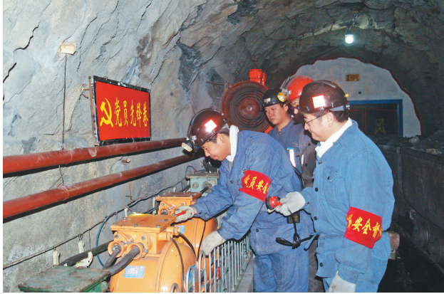
七煤公司党员在井下带头抓好安全生产。

扎实开展基层党组织优化设置“百日攻坚”活动,坚持“宜建则建、宜留则留、宜并则并、宜撤则撤”原则,新建基层党组织100个、撤销基层党组织28个、划分党小组275个,配强党组织书记194名、配齐组织委员等党务工作者549名。细化“三会一课”考勤、请销假、补课、公示和规范记录等基本制度7项,严格量化标准,定期对党支部督促评价;建立党员“党性体检”制度,通过自己查、群众议、互相找、组织评等方式,认真查找理想信念、宗旨意识、精神状态等方面问题,全市4.5万名党员开展“党性体检”;完善“主题党日”制度,开展主题党日优秀案例征集评选活动,评选出30个优秀案例;配套建立以党员“学习日、议事日、奉献日”为主要内容的党员“三日”制度,使之成为党员组织生活的“生物钟”。