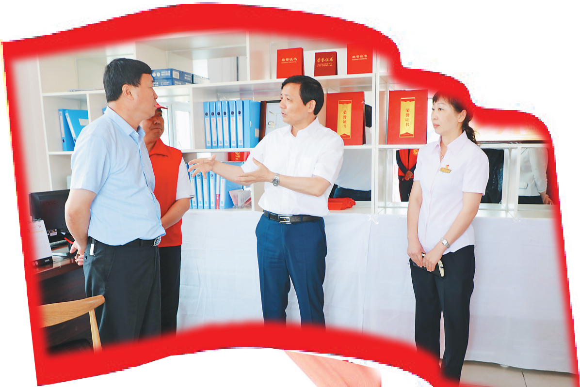
七台河市委书记杨廷双(左三)深入基层党建联系点兴秀社区调研指导。

年初以来,七台河市委深入贯彻落实习近平新时代中国特色社会主义思想和党的十九大、省委十二届二次全会精神,以新时代党的建设总要求和组织工作路线为指导,着力推动基层党建全面进步全面过硬,以基层党建新成效不断激发七台河转型发展全面振兴新动能。