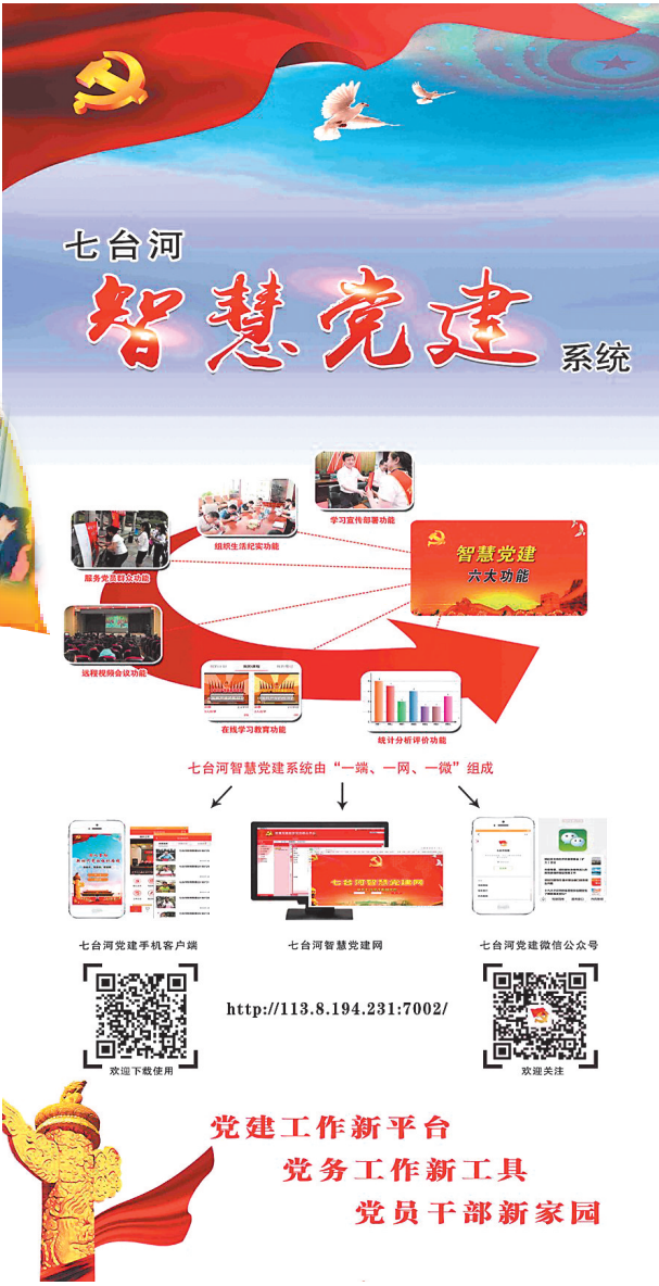
七台河“智慧党建”系统具有便捷高效易用的特点。

围绕实现全市各级党组织和广大党员“会用、爱用、真用”这一目标要求,七台河市委将智慧党建系统的运用情况纳入2018年度区县市委和市直党委(党工委、党组)党建工作责任制考评,逐级建立了七台河智慧党建系统管理员台账,先后召开了智慧党建系统规范使用推进会议,举办智慧党建系统培训班7期,培训骨干管理员500余人,为系统的推广和应用打下了坚实基础。市委组织部还及时组织工作人员深入到各县区和市直各部门,“手把手”的现场指导智慧党建系统的使用和管理,切实将智慧党建系统打造成为全面从严治党的工作平台,充满正能量广大党员喜爱的教育平台,服务全市党组织和党员干部的互动平台,为七台河市转型发展、全面振兴提供更加坚强的组织保证。