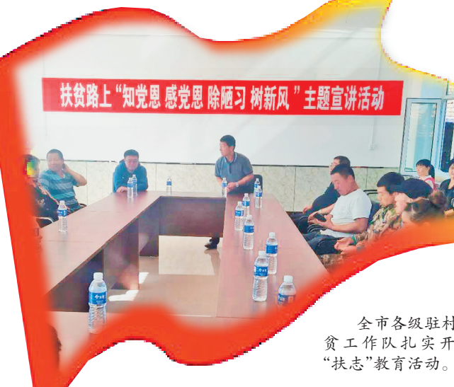
全市各级驻村扶贫工作队扎实开展“扶志”教育活动。