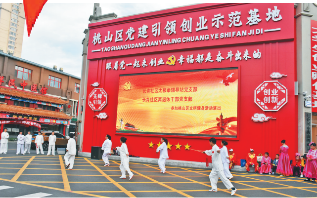
桃山区委通过建立创业园区强化创新创业工作。