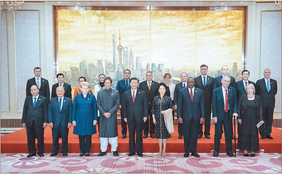
宴会前,习近平和彭丽媛同各国领导人夫妇合影留念。

对接会上,双方就深化合作进行了深入探讨,充分发挥进出口银行政策性金融优势和东北再担保资本实力、风险管控等优势,各展所长,深入推动双方资源、信息等互通共享,为域内企业提供融资支持。据悉,下一步,双方将在振兴东北、普惠金融类、扶持三农类等重点领域以及支持我省进出口贸易、出口创汇业务等重点特色业务领域开展合作,共同促进我省全面振兴全方位振兴。