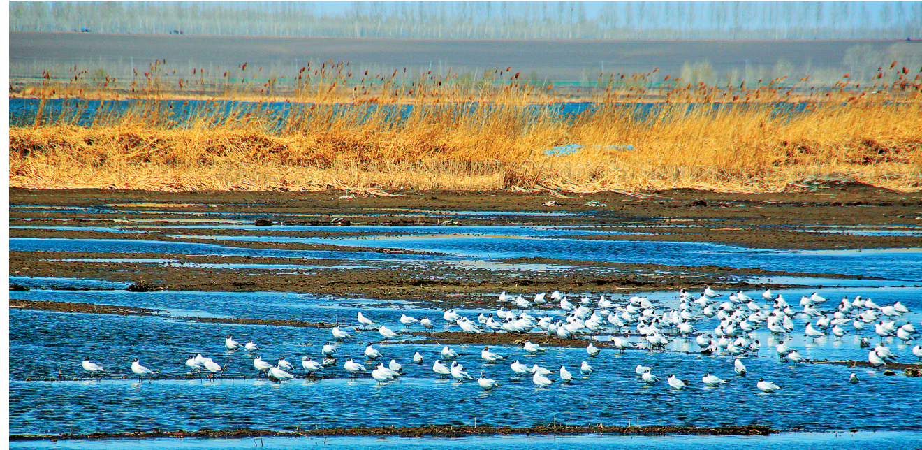
候鸟的天堂。于洋 本报记者 程瑶摄