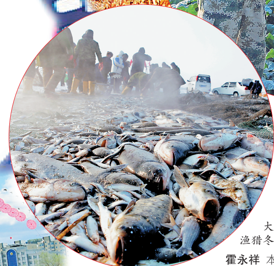
大似海渔猎冬捕。霍永祥 本报记者 程瑶摄