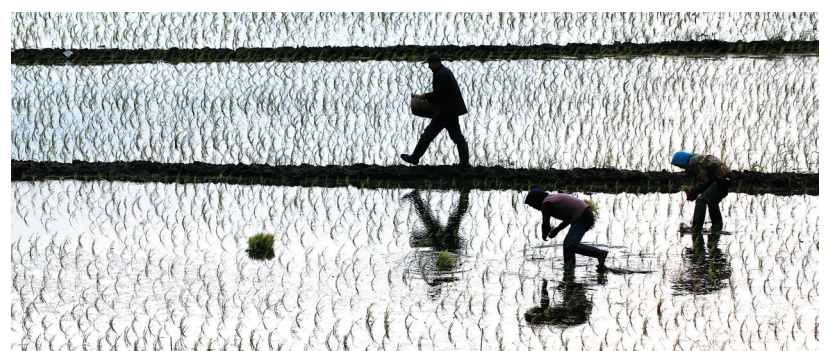
补秧。霍永祥 本报记者 程瑶摄