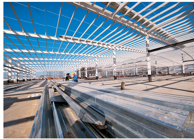
产业项目建设现场。

明,将历史文脉与生态旅游资源相融合。充分挖掘大金代八里城国家重点保护单位、涝洲古渡口、昌五古城、中东铁路等历史遗址,让历史可触摸、让旅游可阅读,为全域旅游奠定历史人文基础。二是深度挖掘生态要素。依托沿江万顷松江湿地、百里原生态水面资源优势,肇东加快建设八里湖、千鹤岛、月亮岛、库塘木、大牛角等沿江旅游景点。三是深度挖掘冰雪要素。以大似海冬捕渔猎文化节为牵动,以大明水、库塘木等湖泊为依托,肇东开展了冰钓、冰上汽车拉力赛、冰雪冬令营等系列活动。围绕乡村振兴,打造“特色小镇”。以实施乡村振兴战略为统领,肇东抓住全国实施“千企千镇工程”、推进特色小镇建设的有利契机,按照“产业特色突出、环境整治优美、设施配套齐全、公共服务到位”要求,着力建设了宋站畜牧小镇、昌五商贸重镇、四站驿站古镇、西八里水乡名镇等特色小镇。同时,肇东还不断推进中心社区规划建设。以中心村、特色村为重点,在能源利用、庭院经济、厕所建设、垃圾处理等方面加快推进,持续加大撤屯并村、拆危拆旧、环境整治、美化绿化力度,培育出一批特点鲜明、内涵丰富、生态优美的美丽乡村。肇东将深入学习贯彻总书记在深入推进东北振兴座谈会上的重要讲话和考察黑龙江的重要指示精神以及省委十二届四次全会精神,通过全力打造“寒地黑土之都先行样板区”、“绿色产业之城创新引领区”、“田园养生之地核心体验区”,实现全面振兴和全方位振兴,让“都城地”建设在肇东落地生根、开花结果。