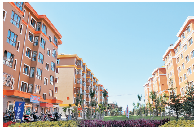
现代农家。霍永祥 本报记者 程瑶摄