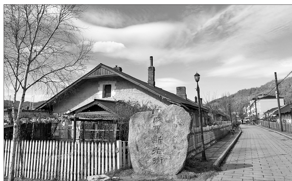
横道河子镇上的俄罗斯老街。