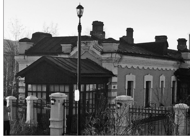
艺术家的工作室。