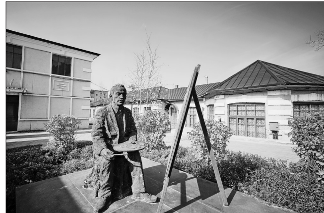
油画村里的雕塑。