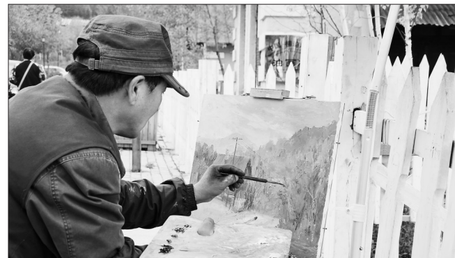
随处可见前来写生的画家。