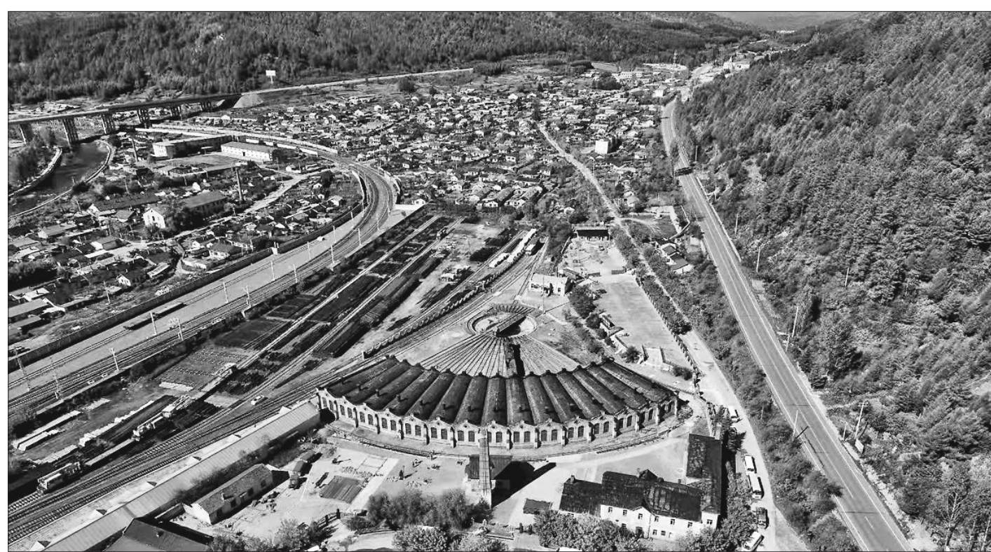
别具风情的横道河子镇。