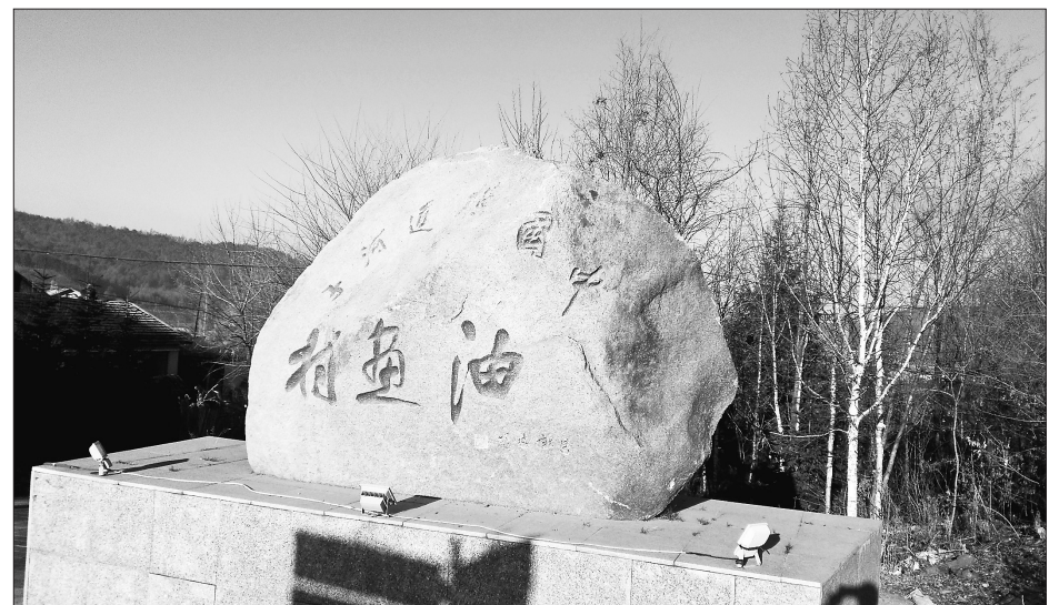
中国·横道河子油画村村名石刻。