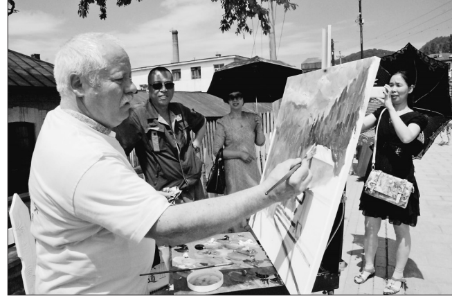
2014年,中俄油画大赛,俄罗斯画家写生场景。