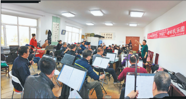
造纸社区夕阳红老年民乐团认真合练。

地域特色文化根植于本土,来源于生活,因历史的积淀有着广泛的群众基础。佳木斯是北大荒精神发源地、东北抗联的主战场,赫哲族世代生息的故乡,具有浓郁的东北民俗风情。这里被誉为“东北小延安”,我国第一部新闻纪录片《民主东北》、第一部故事片《桥》、第一部动画片《皇帝梦》就诞生于此。著名音乐家马可在佳木斯创作出经典歌曲《咱们工人有力量》历久弥新,传唱至今。“伊玛堪”作为赫哲族口耳相传、世代传承的民间原生态说唱艺术收入到首批“国家级非物质文化遗产保