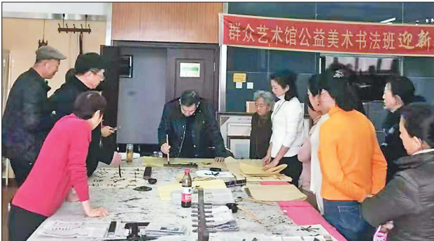
佳木斯市群众艺术馆公益书法班。