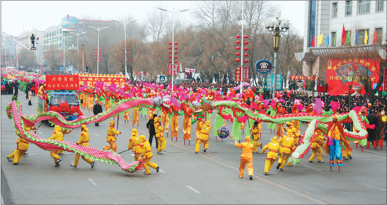
富锦市举办秧歌节活动。