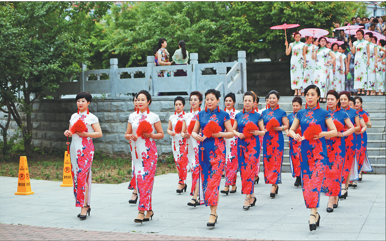
群众文化协会组织的千人旗袍秀。 谢佳伟 本报记者 贾立群摄

文化建设是民生幸福的显著标志,承载着人民群众对美好生活的热切向往。活动有场地,演出有舞台,读书有去处,健身有器材……一个个文体惠民举措,让佳木斯百姓在“家门口”乐享“文体福利”。