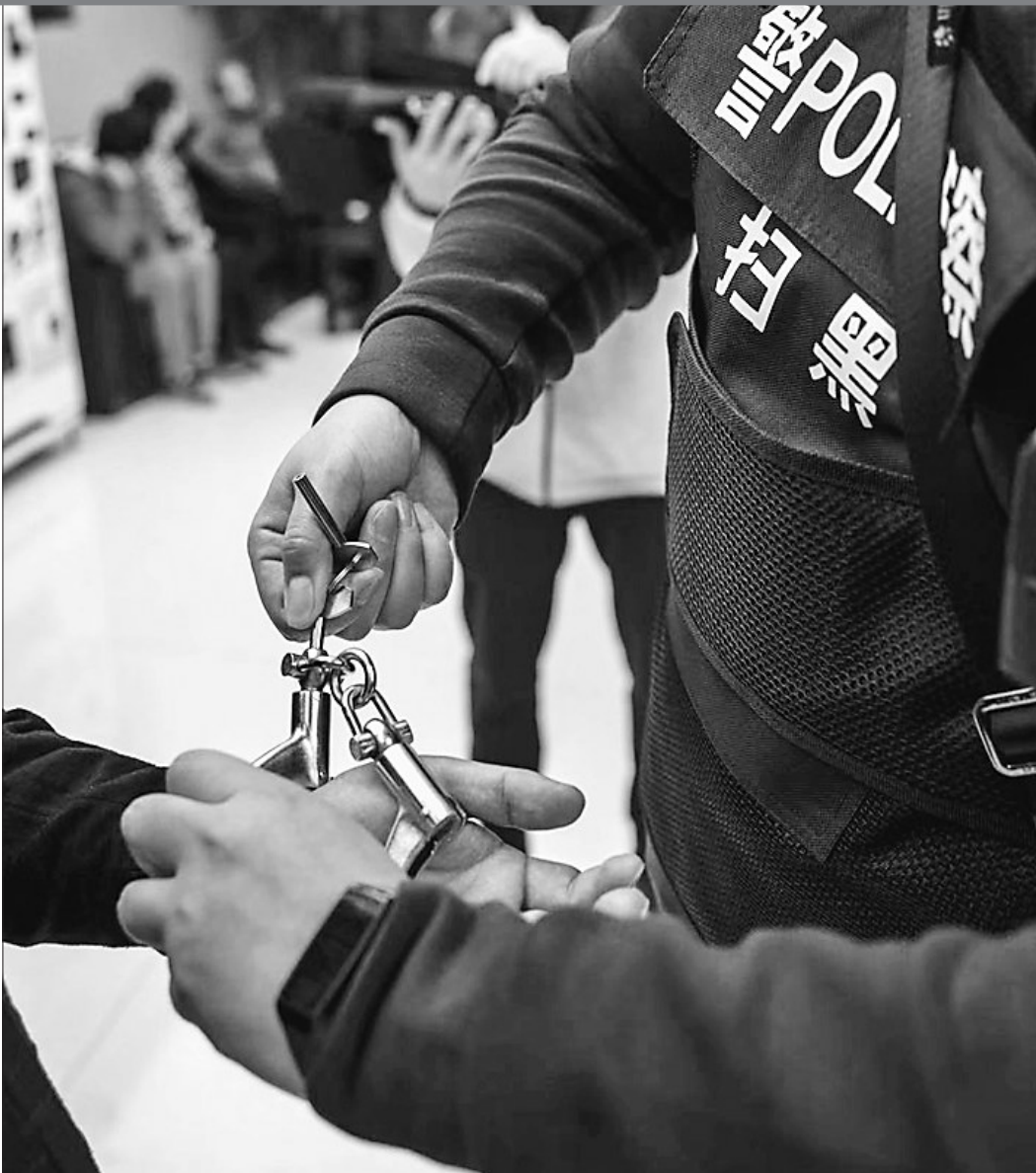
哈尔滨市公安局加大深挖保护伞的力度,一批批幕后保护伞被经侦归案。