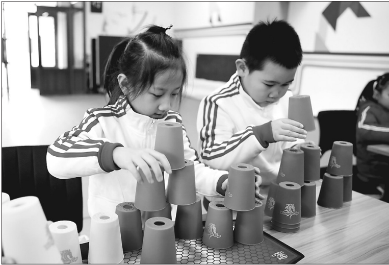
近日,哈尔滨市师范附属小学第五届智力运动会拉开帷幕,智力运动会包括七巧板拼图、魔方以及363飞叠杯接力等比赛。

情况,市区“4555”人员灵活就业基本医疗保险补贴标准为:基本医疗保险补贴9.5%缴费的灵活就业人员按每人每年1248元执行,6.5%缴费的灵活就业人员按每人每年853元执行,5%缴费的灵活就业人员按每人每年656元执行,参加城镇居民医疗保险的灵活就业人员不享受基本医疗保险补贴。申领社保补贴时段为2017年10月~2018年9月。符合申报条件的灵活就业人员(现已取消到指定地点进行信息采集环节)携带相关证件在11月26日~12月8日前到户籍所在地社区劳动就业社会保障服务站进行申报,逾期没有申请者可以在2019年3月18日~4月12日申请补办。