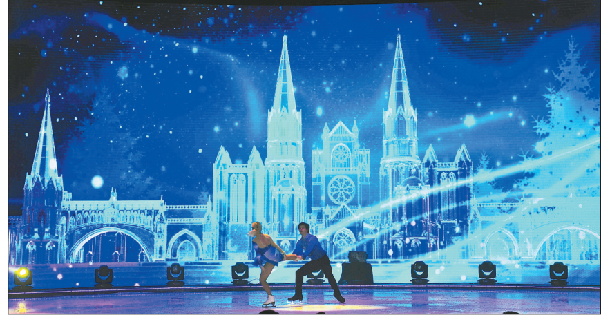
“哈冰秀”上演世界顶级视觉盛宴。