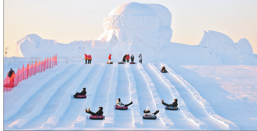
雪博会上,游客尽享雪滑梯乐趣。