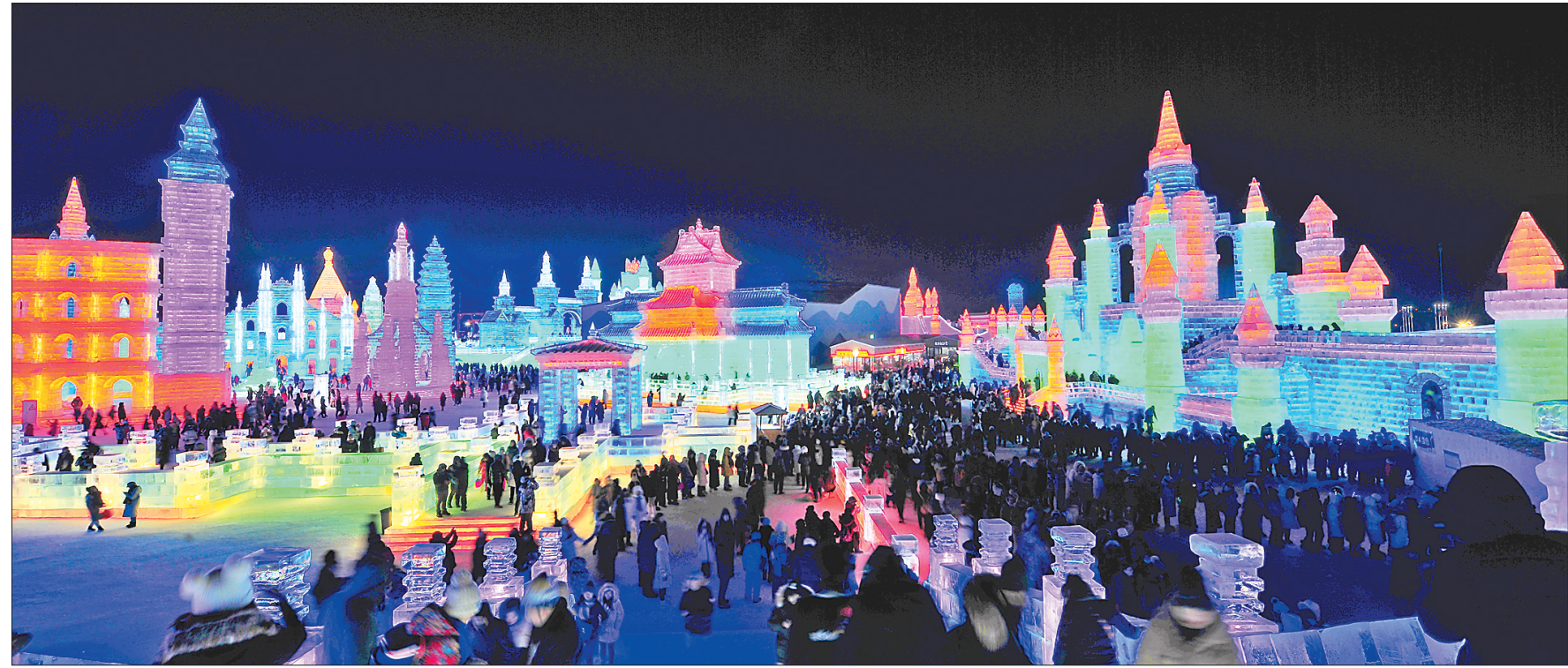
哈尔滨冰雪大世界游人如织。

九站公园江堤上、通江广场下的部分安全区域江面上,2019个雪人齐齐亮相,所有雪人不设围栏,全部免费开放。其中,在通江广场,20.19米高的雪人高高伫立,成为这个冬天里游人争相拍照的人气地标。 在旅游产品供给丰富的同时,公共服务质量也不断提升。哈尔滨游客服务中心的升级改造和哈尔滨旅游客运智能服务平台的运营,使得哈尔滨服务全省旅游业的龙头作用更加凸显。 哈市还多措并举加强冬季旅游市场监管。哈市专门设立旅游诚信基金,为游客提供简明快捷的维权通道,让游客玩得开心,游得舒心。