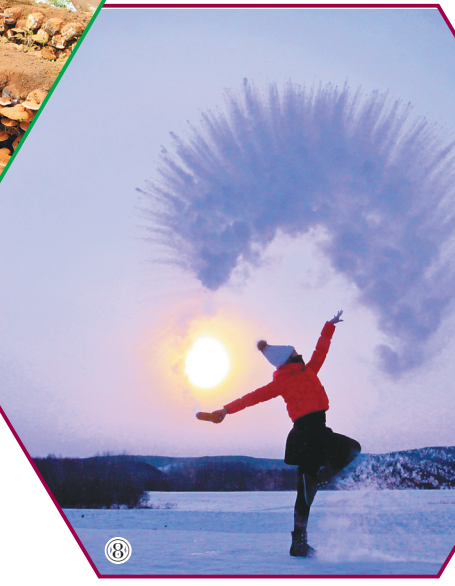
⑤树种培育。 ⑥灵芝栽培。 ⑦林特产品。 ⑧放水成冰。 ⑨南瓮河湿地。