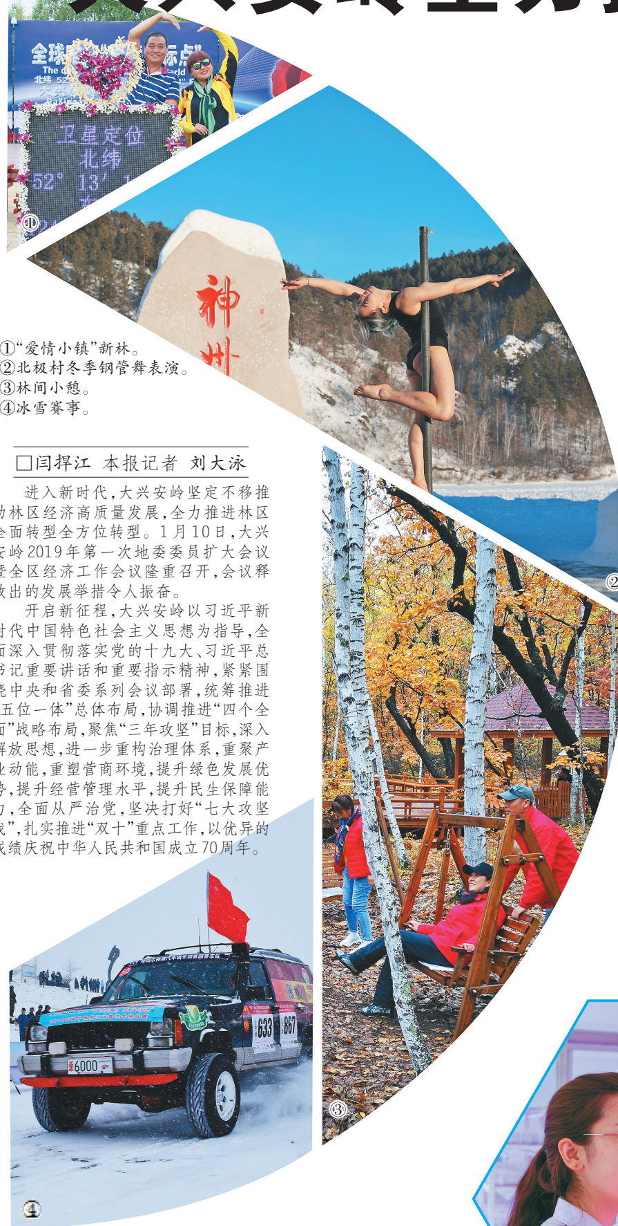
①“爱情小镇”新林。 ②北村村冬季钢管舞表演。 ③林间小憩。 ④冰雪赛事。