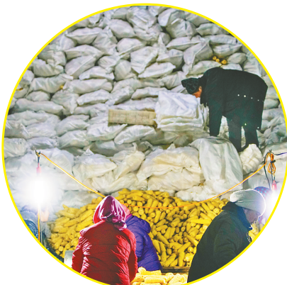
天色渐暗,园区里仍是一派繁忙的景象。