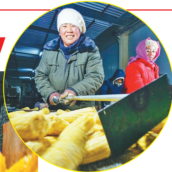
家门口务工让增收顾家两不误。