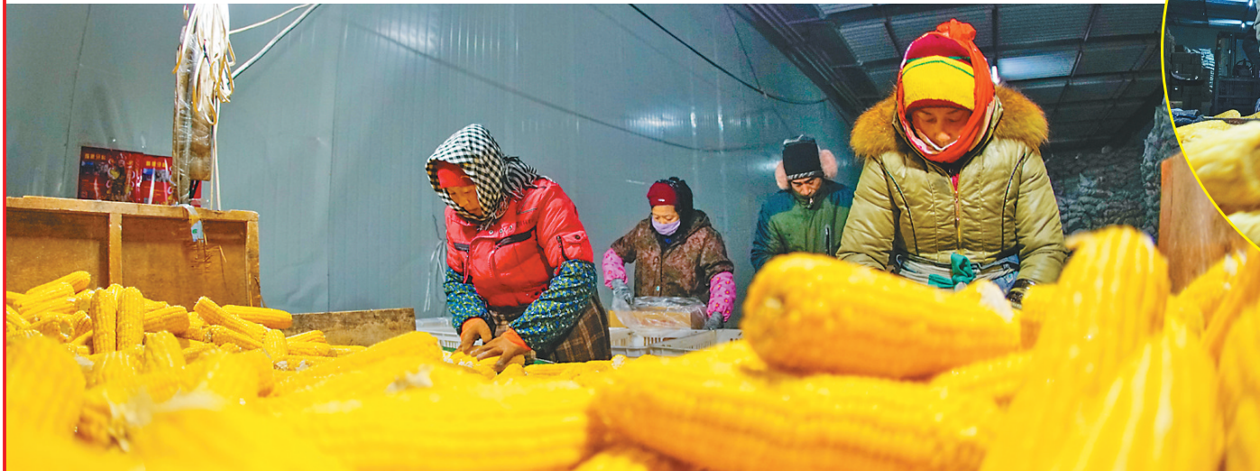
金黄的玉米铺就黄金“增收链”。