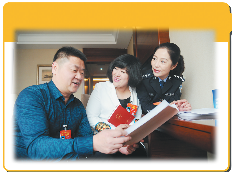
↑来自我省的全国人大代表魏春(右一)、孙艳玲(中)和李建强在驻地房间内就今年的两会建议进行交流。