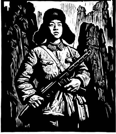
《雷锋》 版画 吴强年