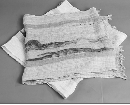
印制着冰雪山水画的亚麻图中。