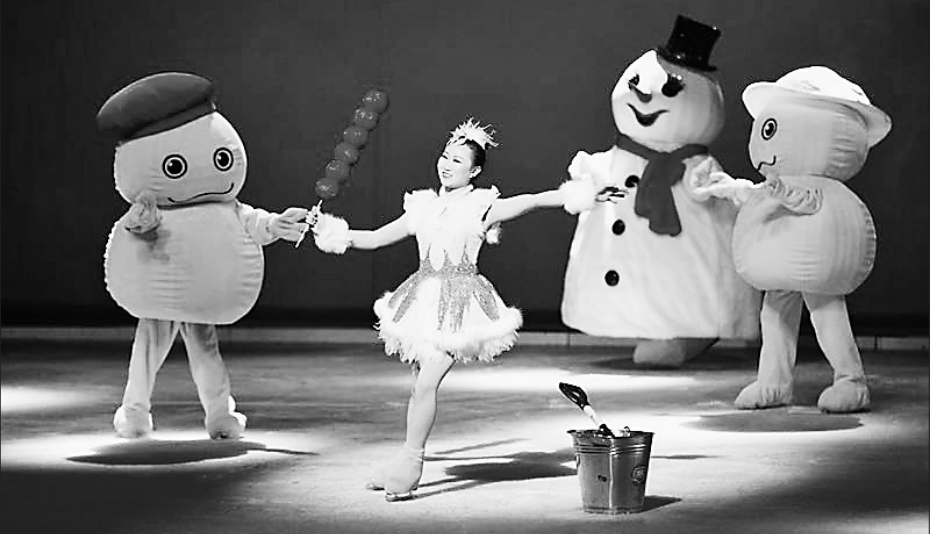
情境冰秀《遇见·哈尔滨》剧照。

近年来,冰雪文化已成为黑龙江形象的重要标识,冰雪产业成为黑龙江经济的重要支柱。在把优质文化资源转化为旅游资源的过程中,如何在景区呈现独具本土特色的冰雪文化?如何以冰雪为特色发展黑龙江的演艺产品和文创产品?业内人士和相关专家向记者畅谈了他们的观点和为此进行的积极实践。