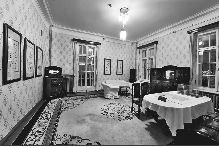
毛泽东视察黑龙江期间题词室复原场景。