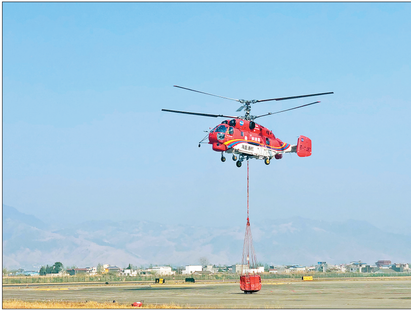
4月1日,灭火直升机从西昌机场起飞。