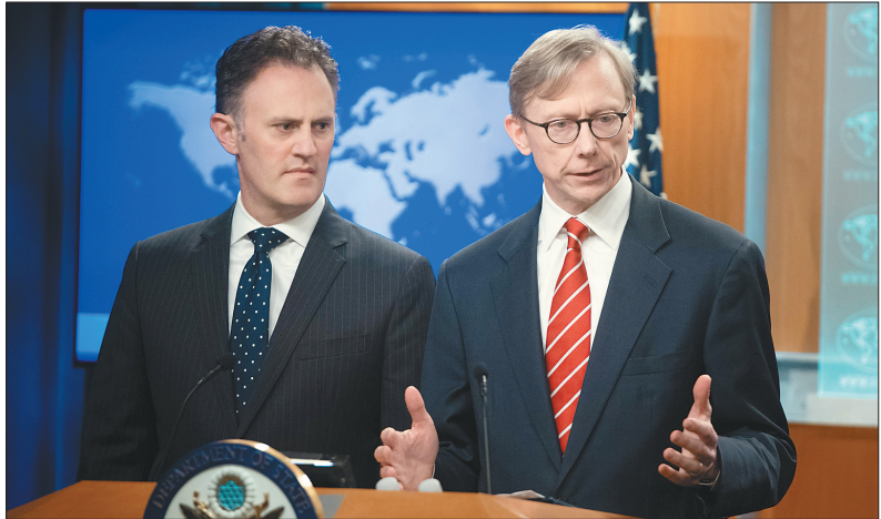
4月8日,在美国华盛顿,美国“伊朗问题特别代表”布赖恩·胡克(右)与国务院反恐协调员内森·塞尔斯出席新闻发布会。